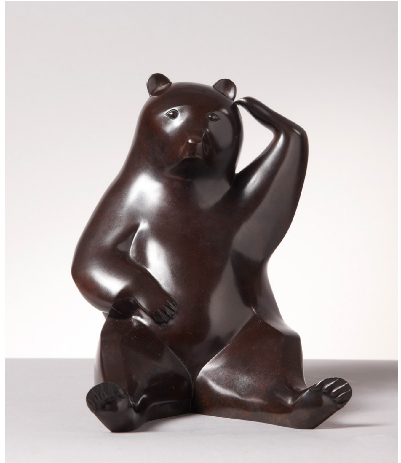
Ours se Grattant Scratching Bear 挠头的熊