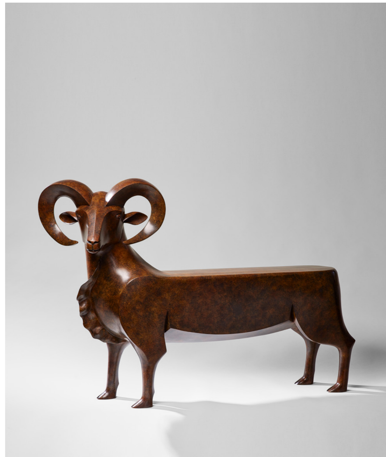
Banc Mouflon Mouflon Bench 摩弗伦羊长凳