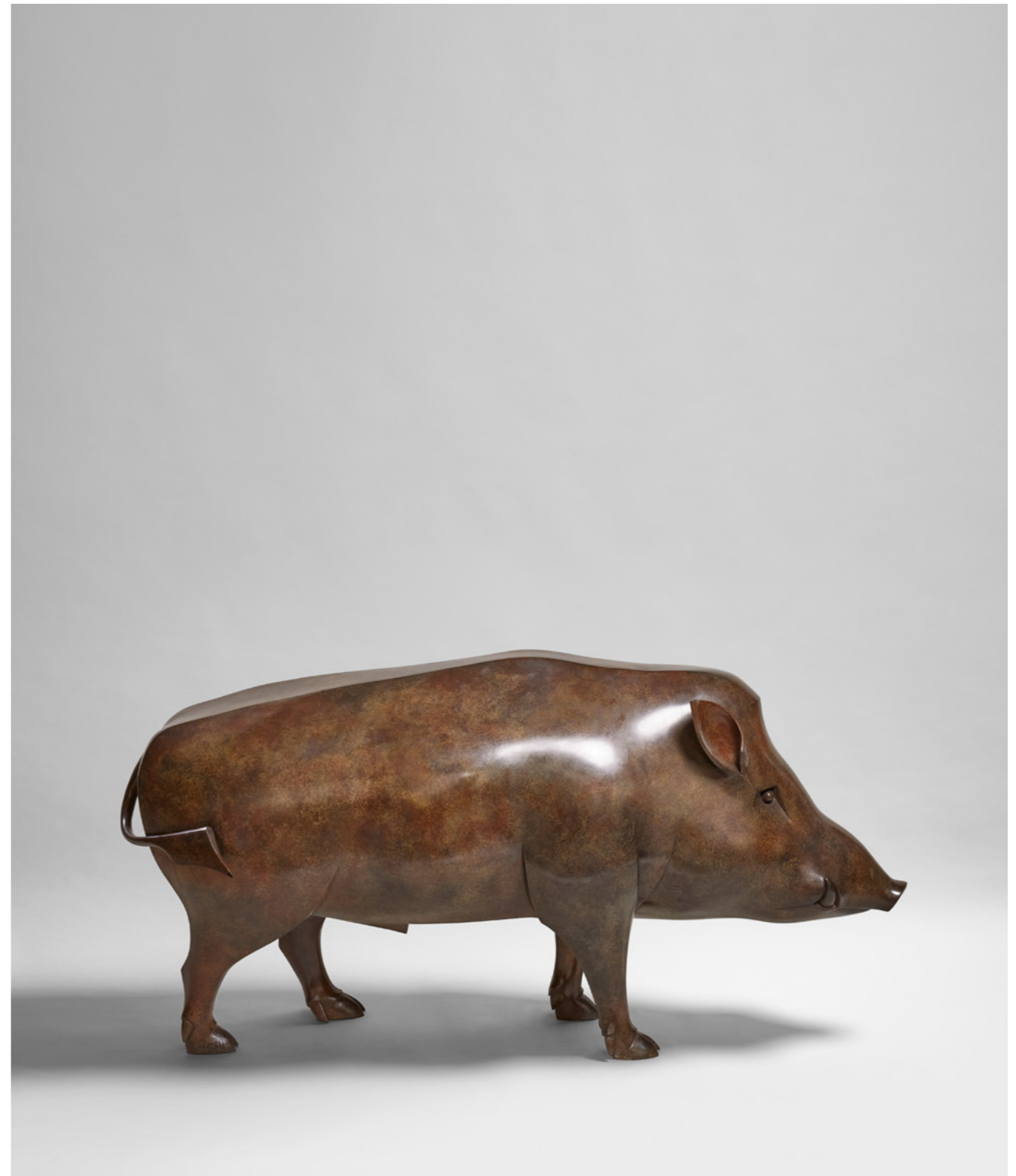
Guillaume l'Ardennais Guillaume of the Ardennes 阿尔登 - 纪尧姆