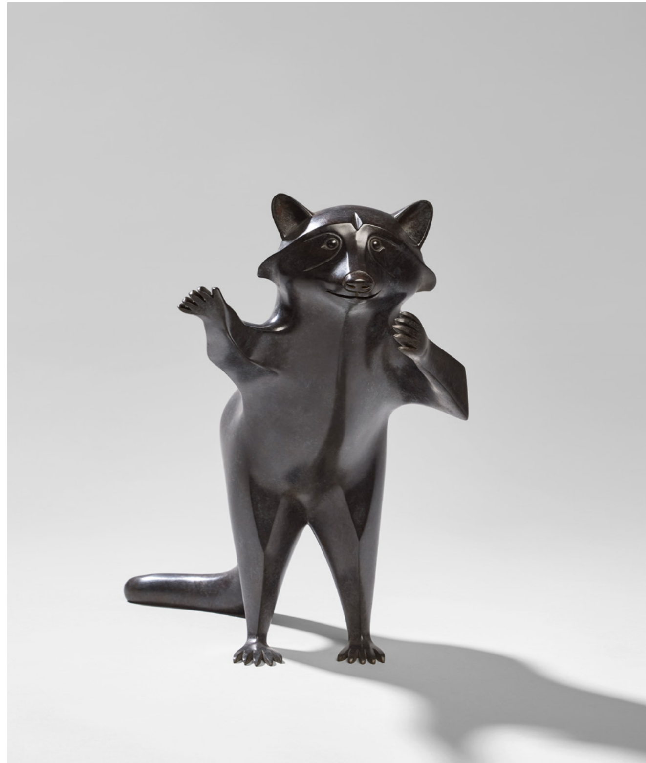
Raton-laveur Chuchoteur Whisperer Raccoon 轻唤的浣熊