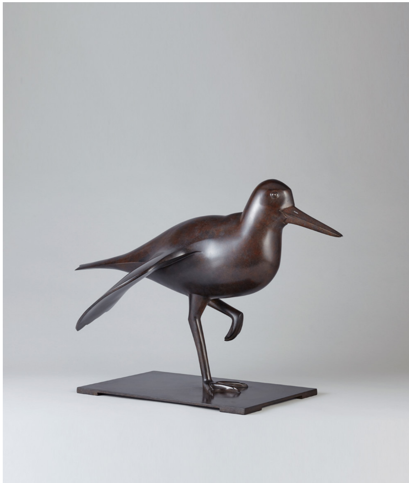
Huïtrier Pie Oystercatcher 蛎鹬