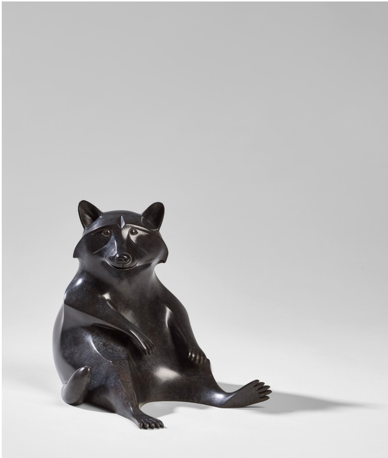
Raton-laveur Assis Seated Raccoon 坐着的浣熊