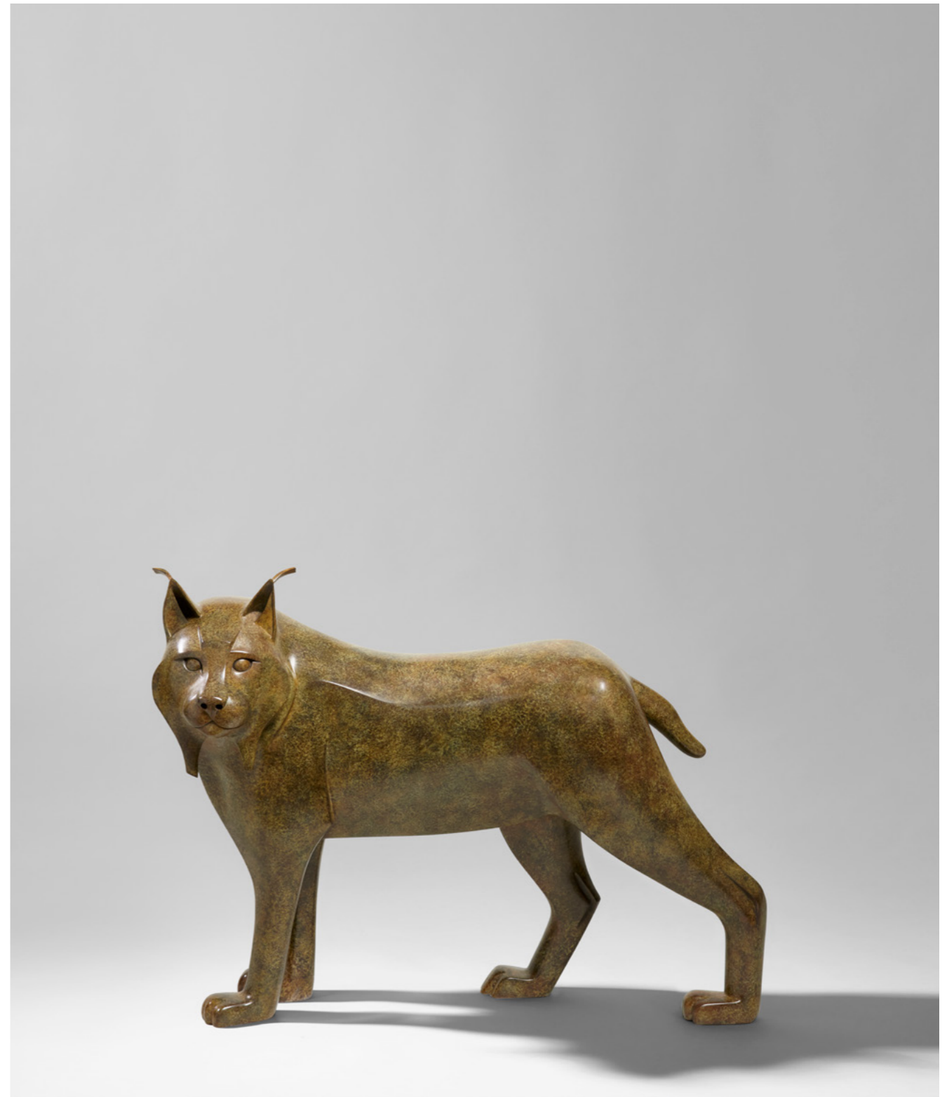
Lynx Lynx 猞猁