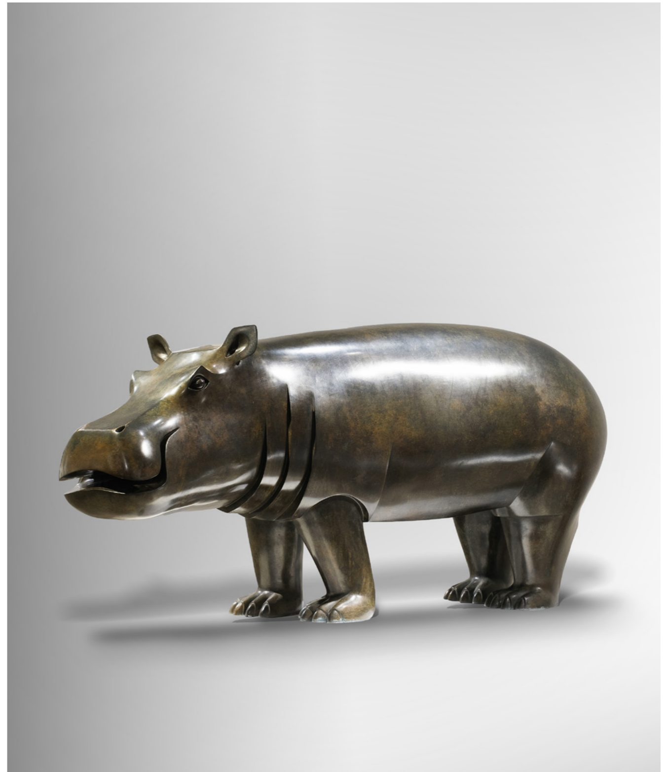
Jeune Hippopotame Young Hippopotamus 小河马