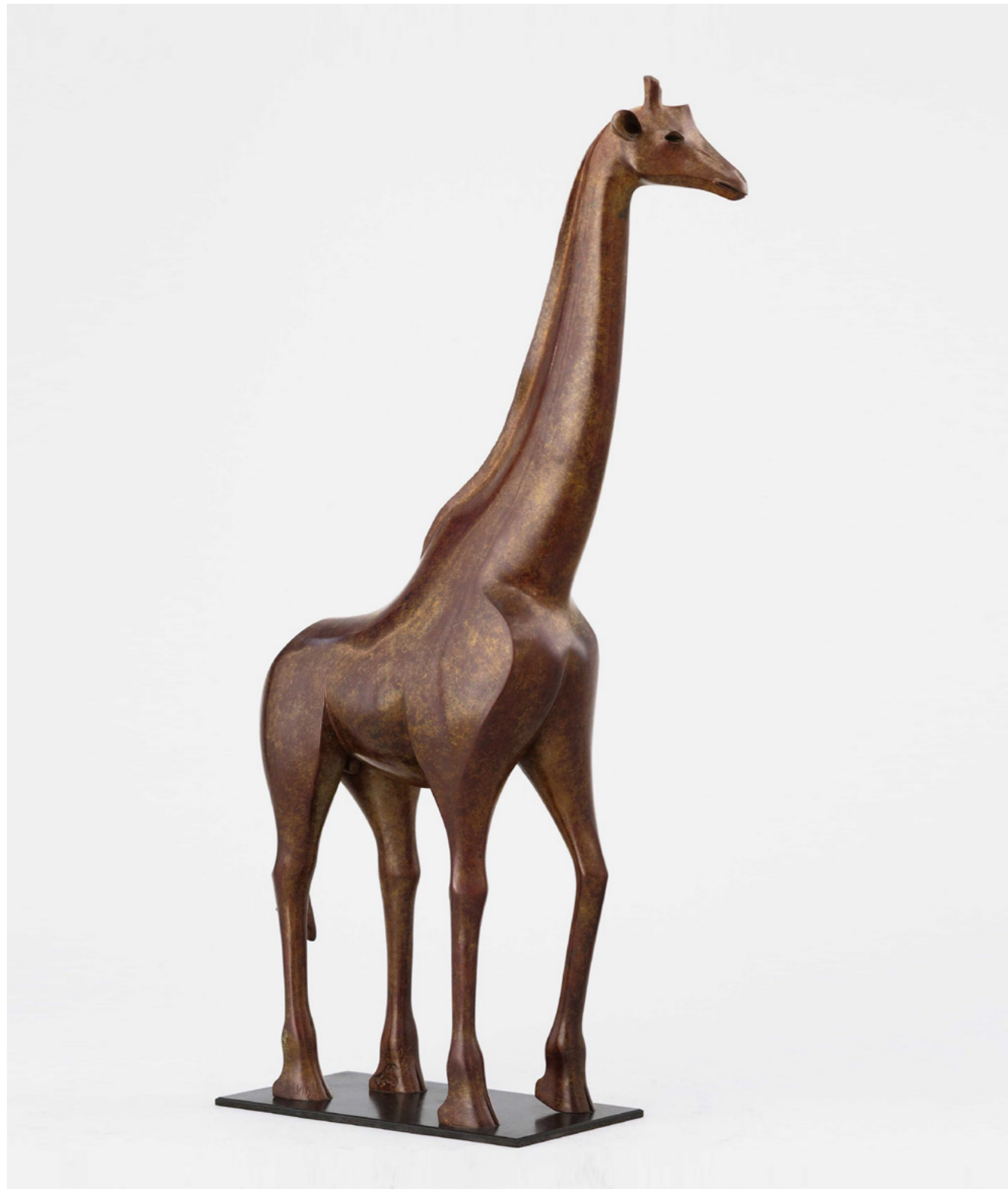
Girafe, modèle intermédiaire Giraffe, intermediate model 长颈鹿, 中型雕塑