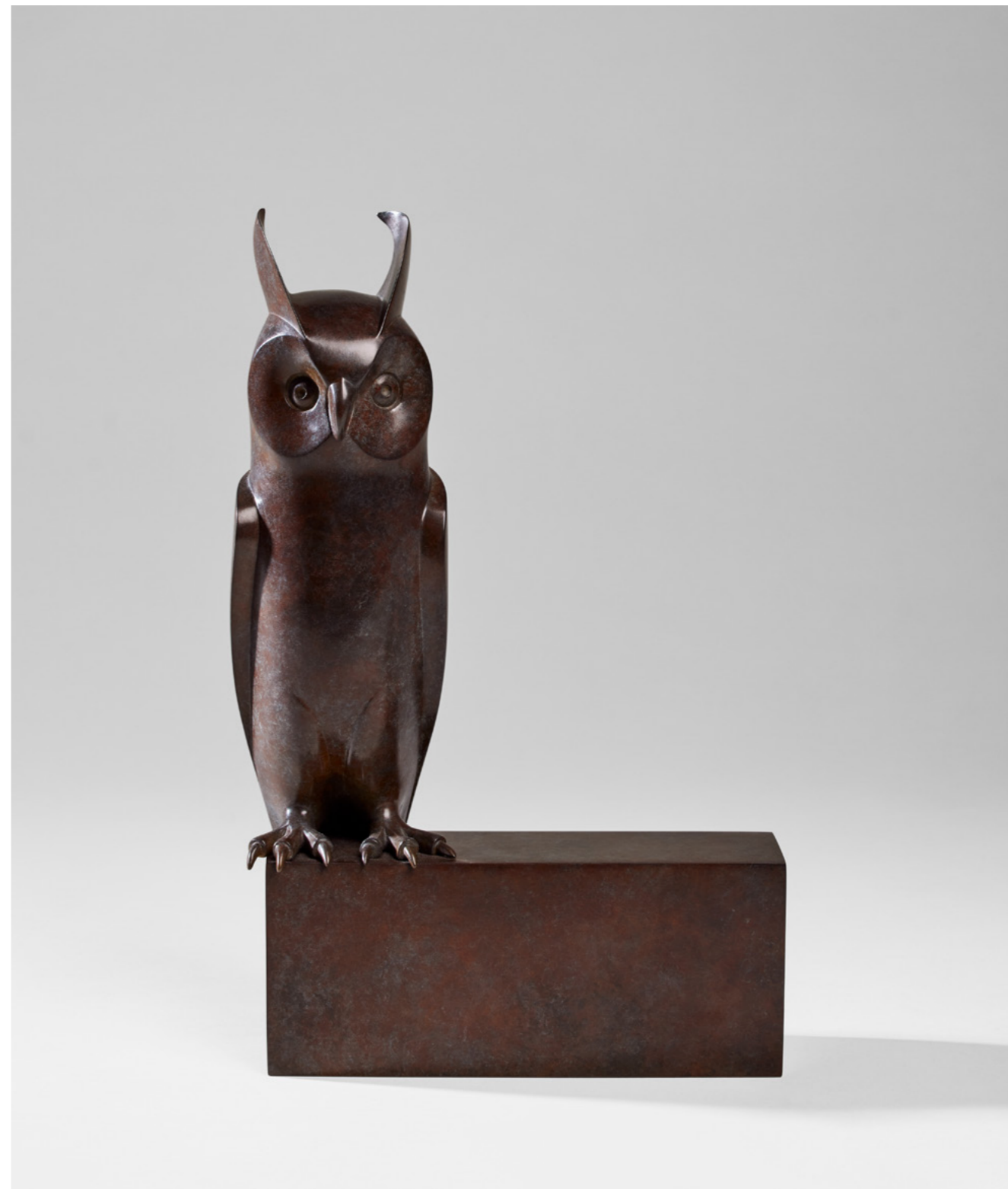
Petit Moyen Duc Small Long-eared Owl 小长耳猫头鹰