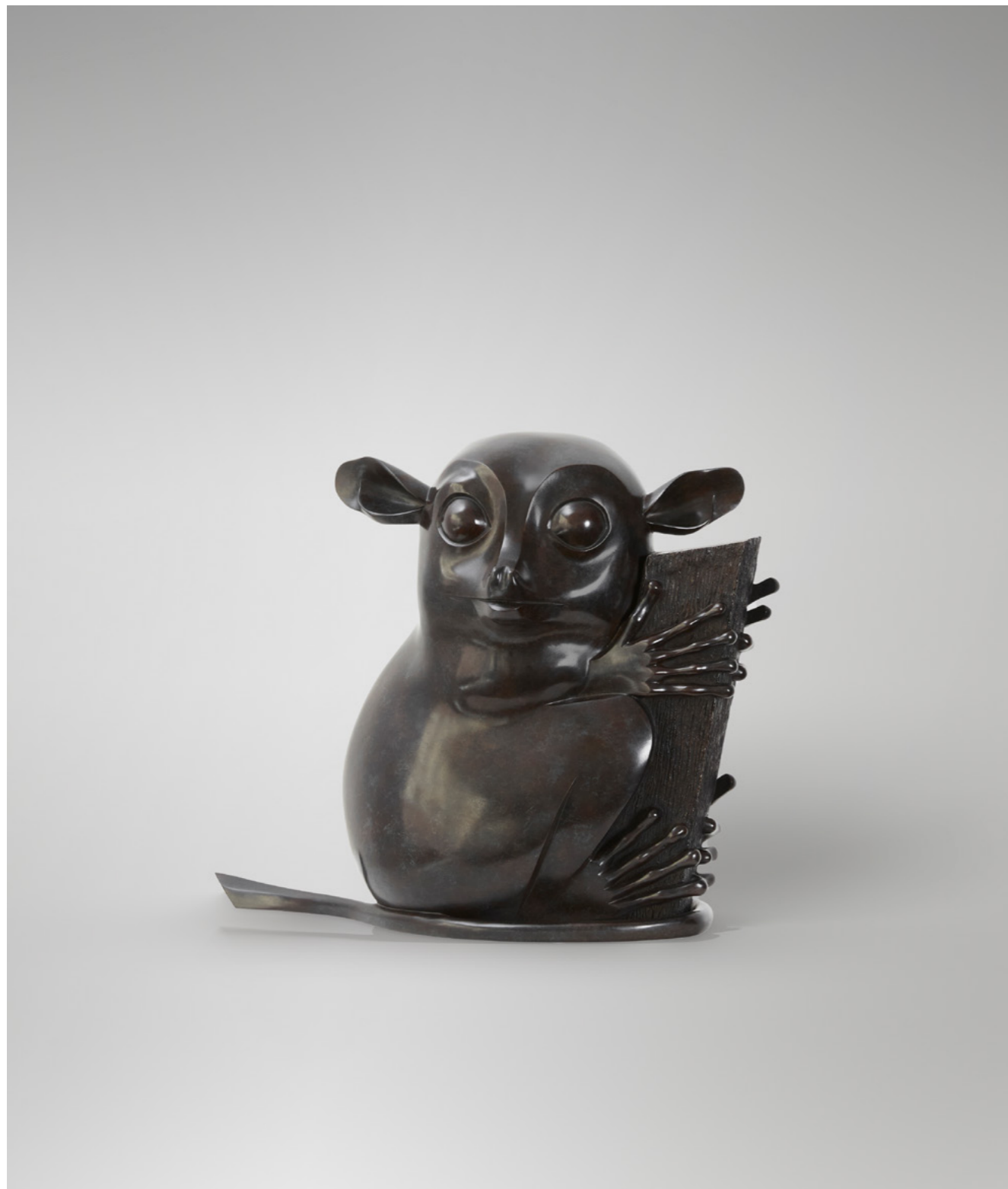
Yoda le Tarsier Yoda the Tarsier 眼镜猴 - 尤达