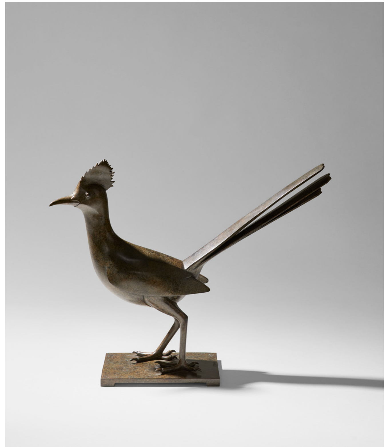
Bip Bip le Grand Géocoucou Bip Bip the Greater Roadrunner 走鹬 - 哔哔