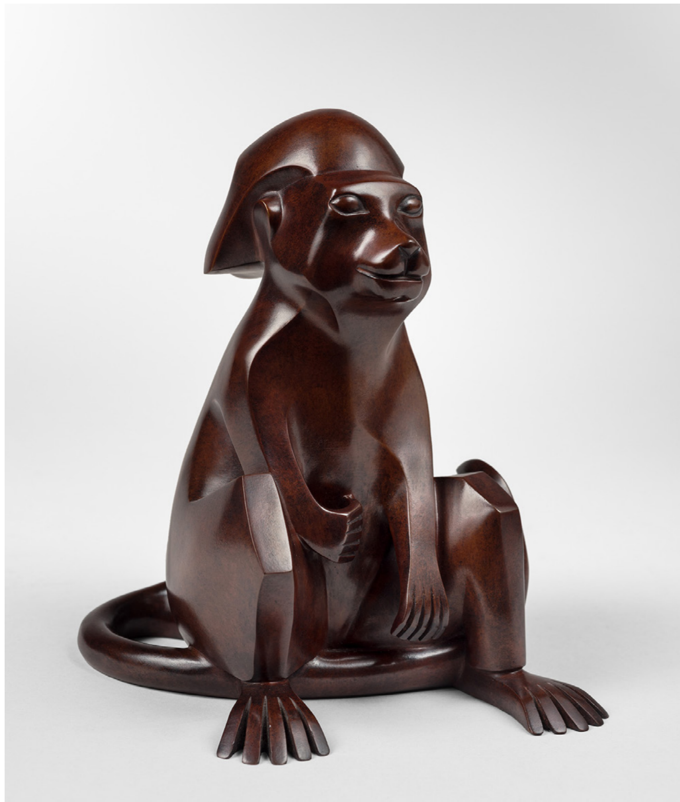
Tamarin Tamarin 金丝猴