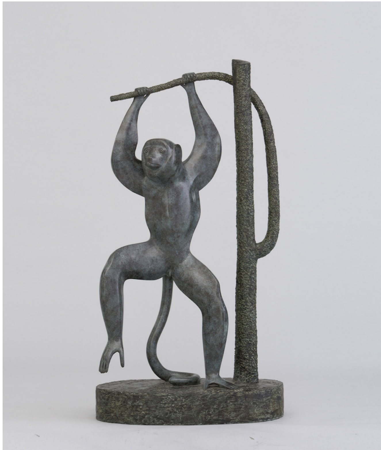
Lémurien Prophétique Lemur 狐猴