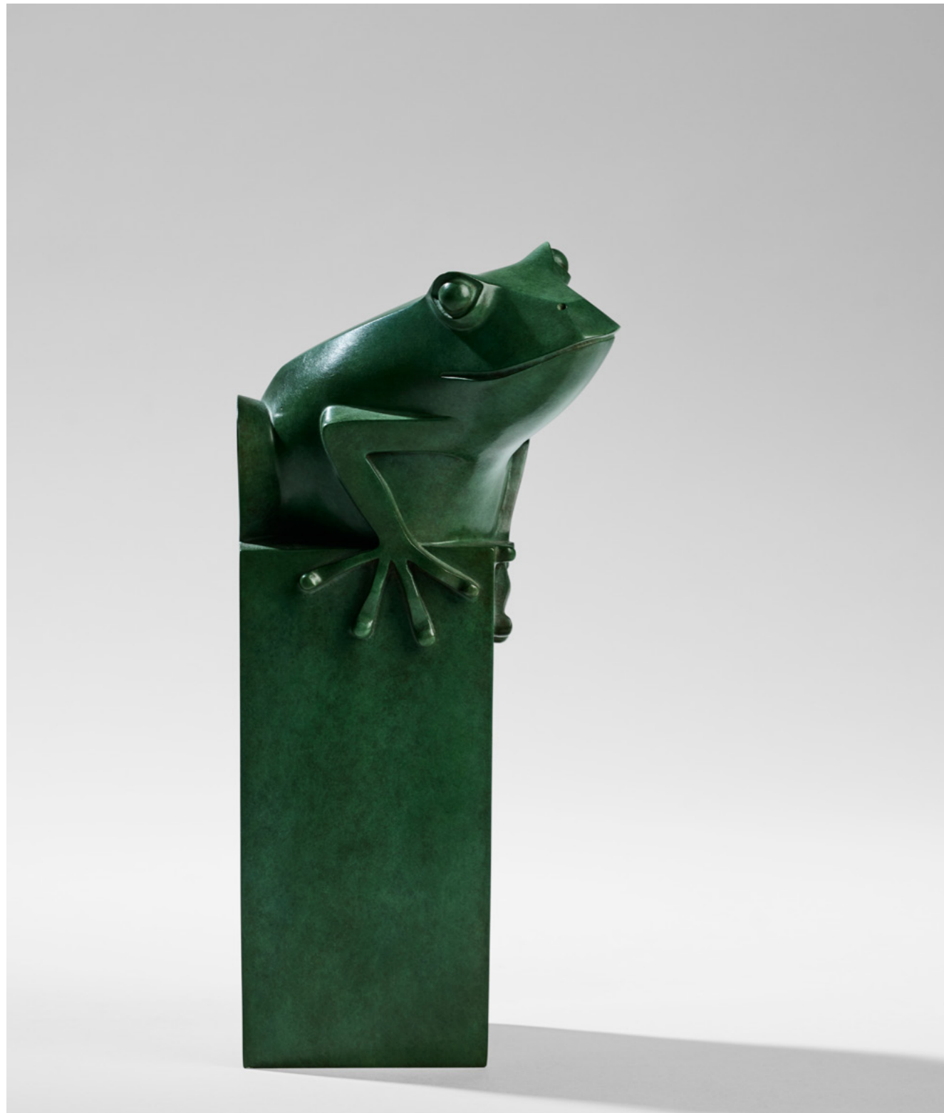
Grenouille Frog 青蛙