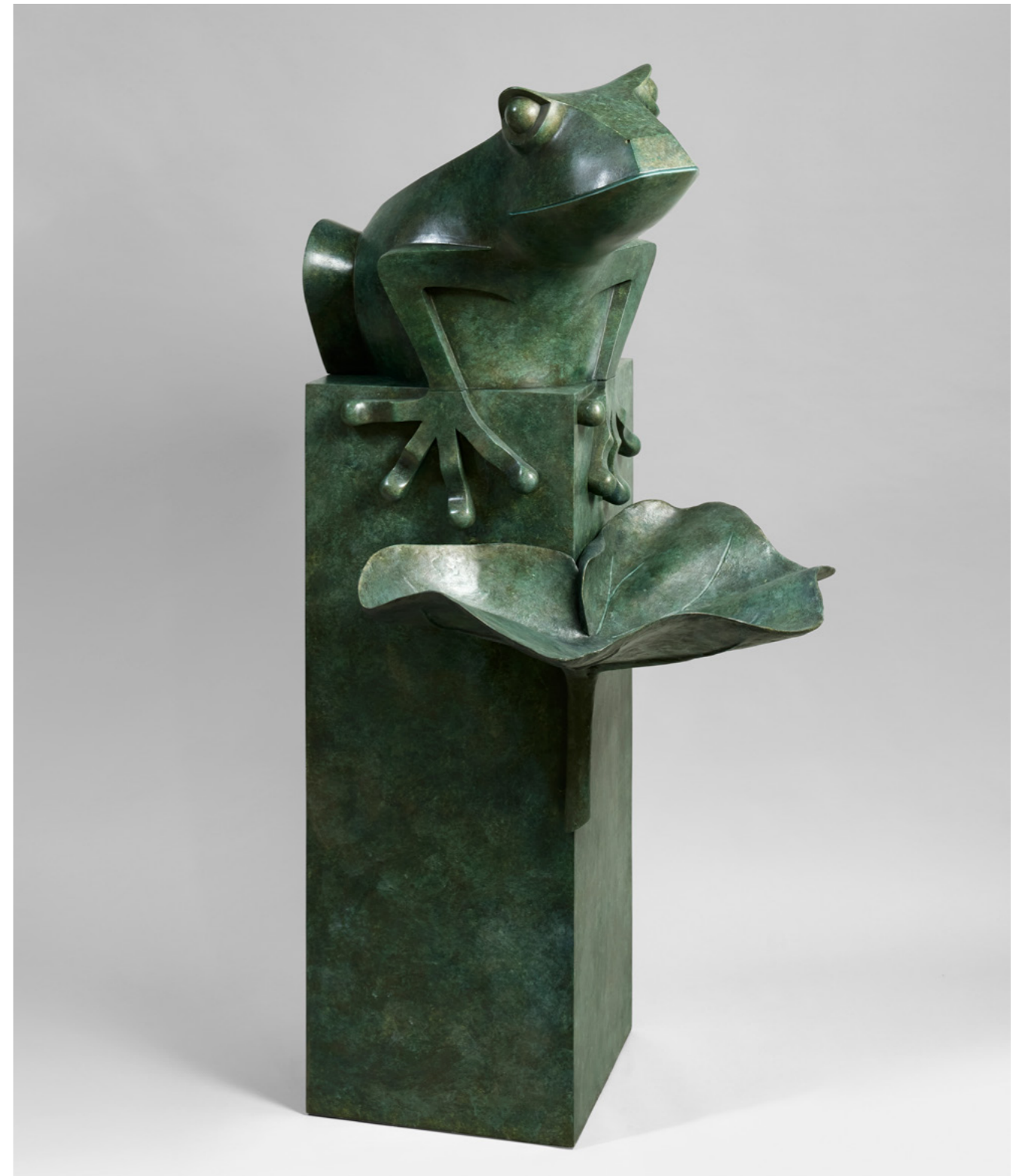
Fontaine Grenouille Frog Fountain 青蛙喷泉