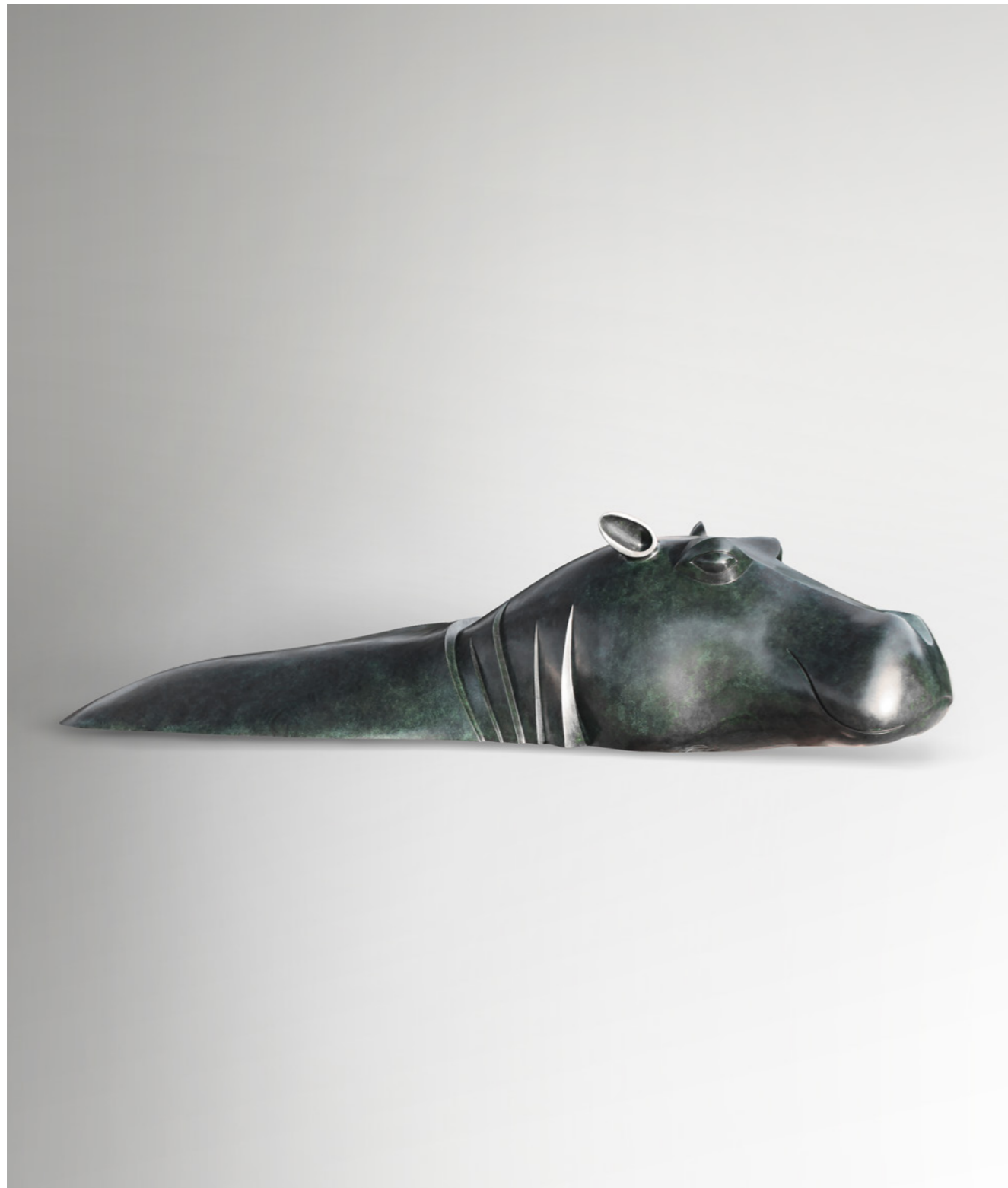
Barnaby, modèle monumental Barnaby, monumental model 巴纳比, 大型雕塑