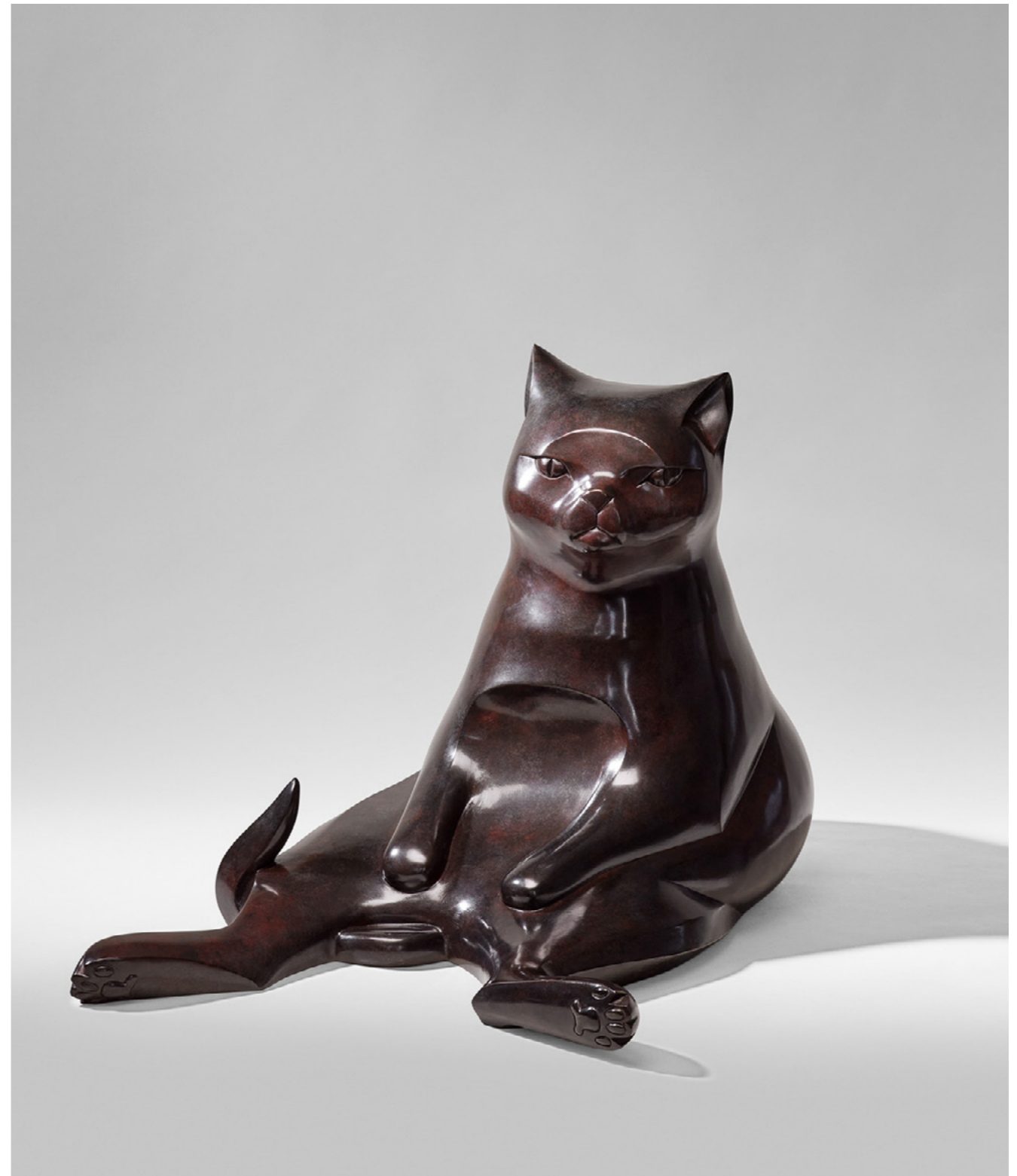
Lola Lola 罗拉