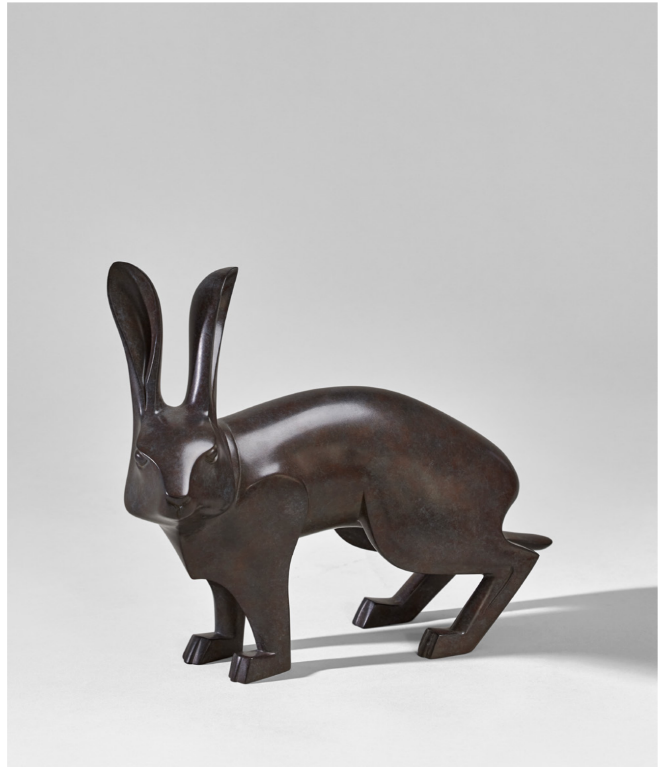
Levreau Young Hare 小野兔