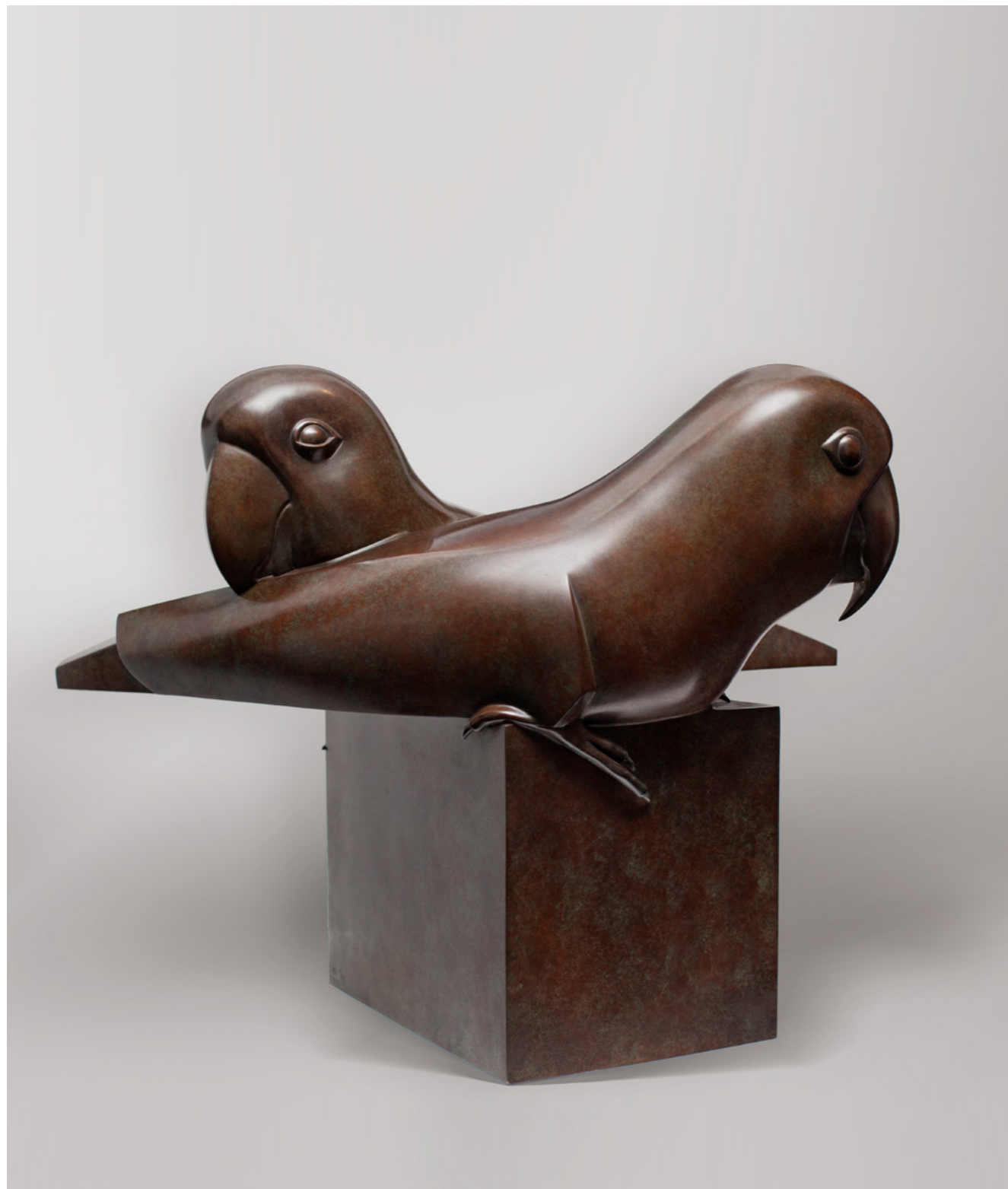
Les Inséparables Lovebirds 情侣鹦鹉