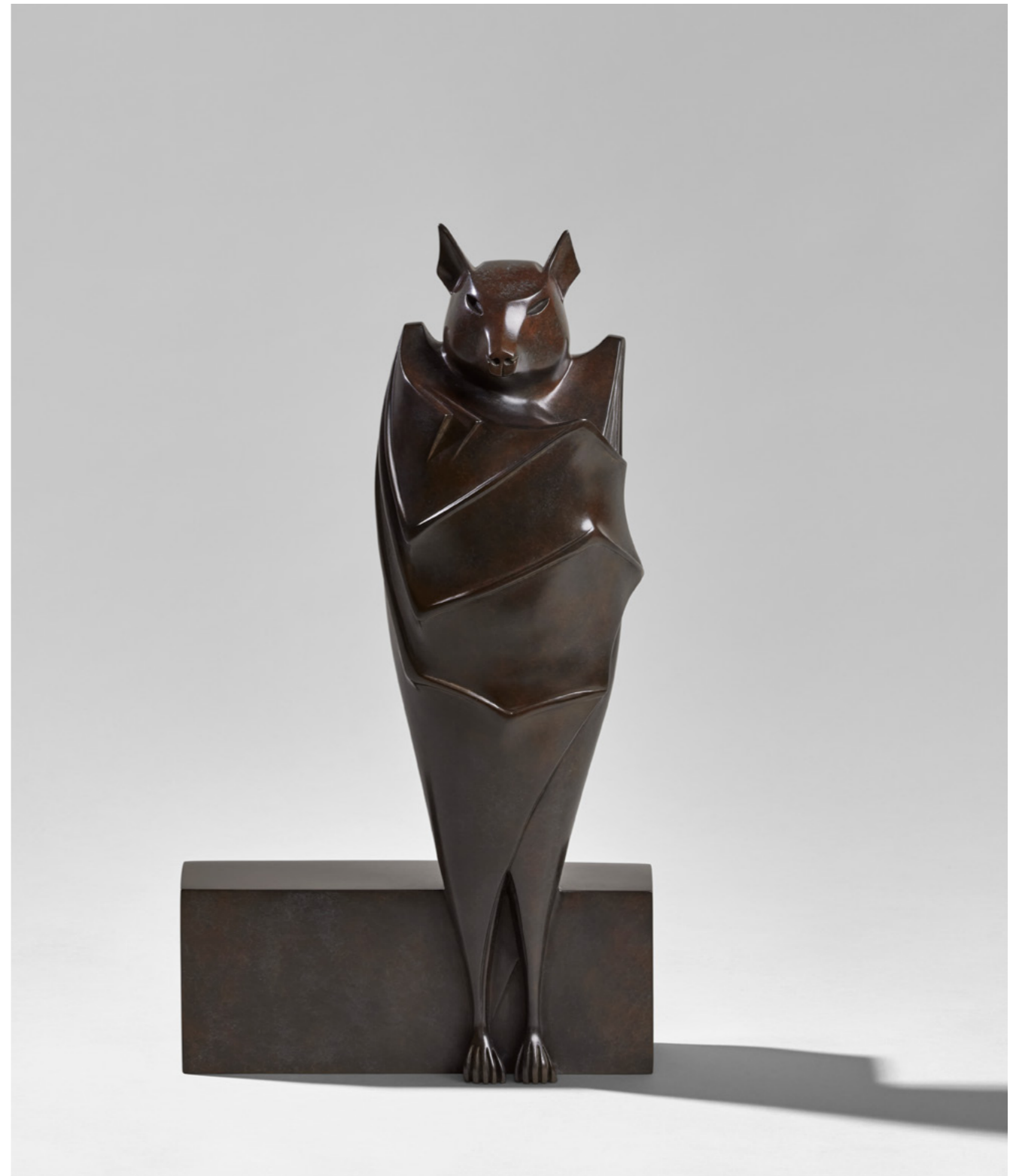
Roussette à Couronne Dorée Acerodon Jubatus 鬃毛利齿狐蝠