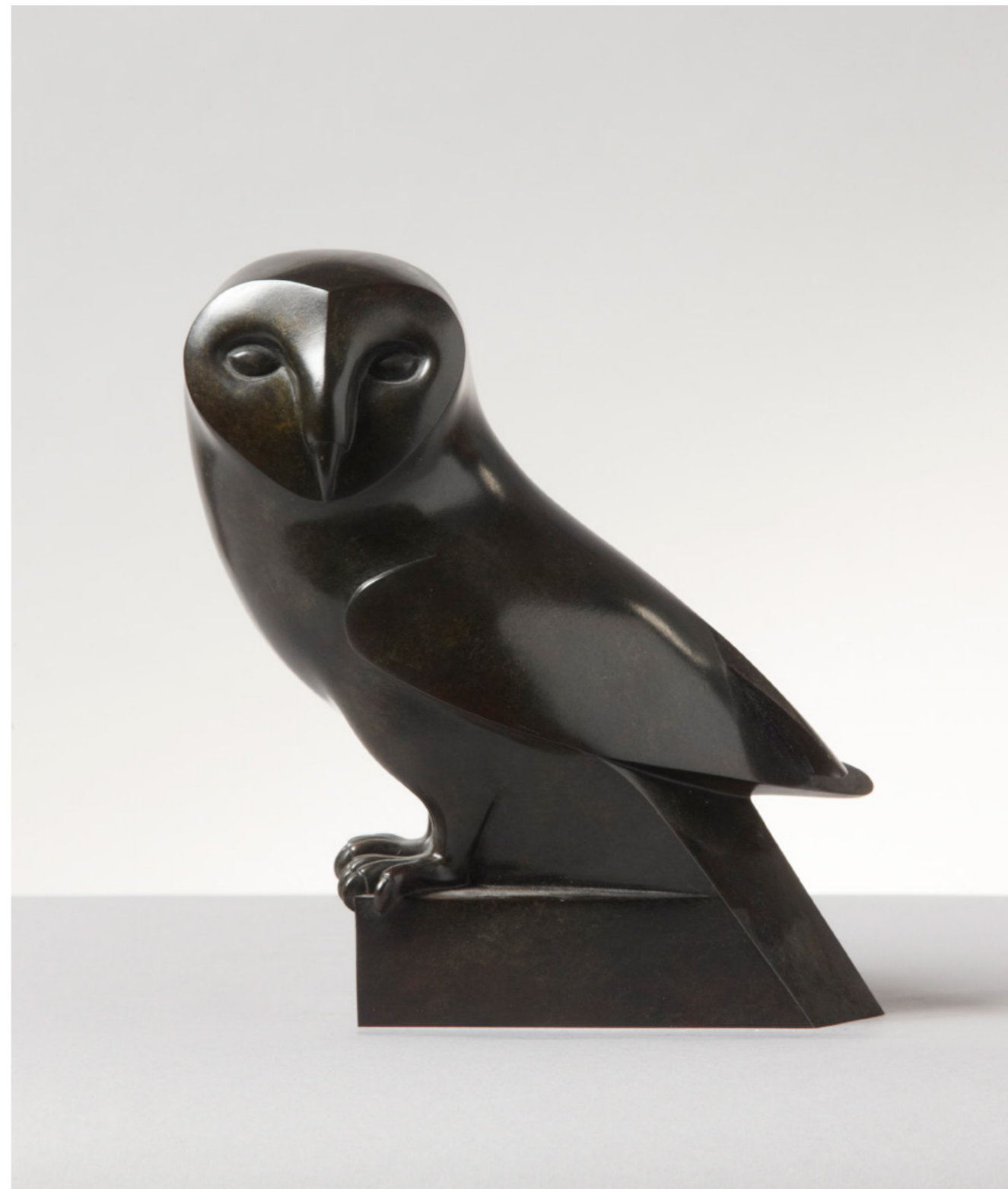
Chouette Effraie Barn Owl 仓鸮