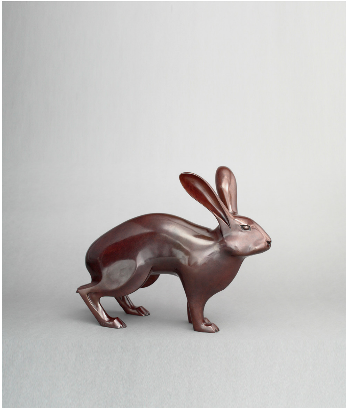
Lièvre de Belgique Belgian Hare 比利时野兔