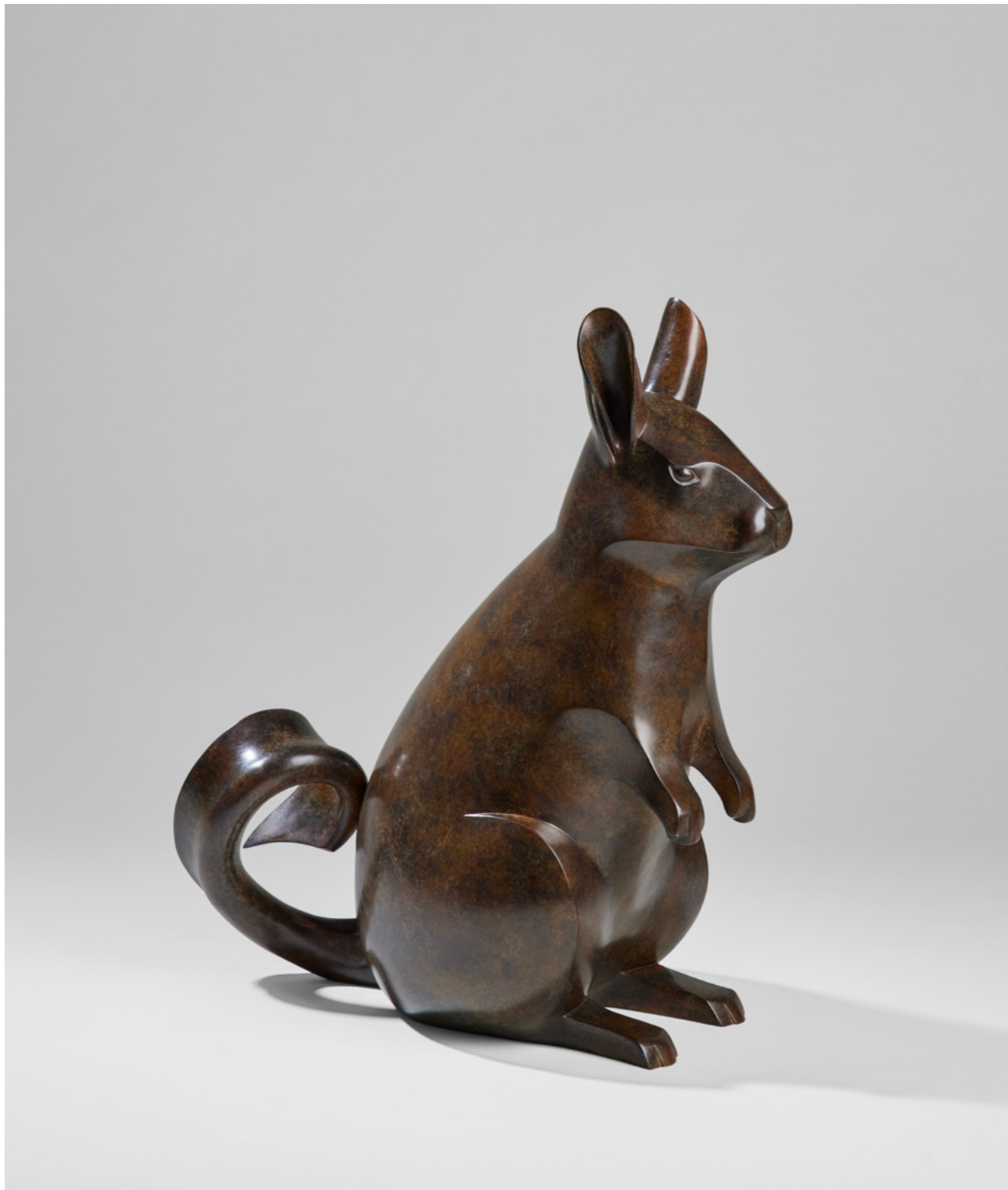
Lapincureuil Vizcacha 鼠兔