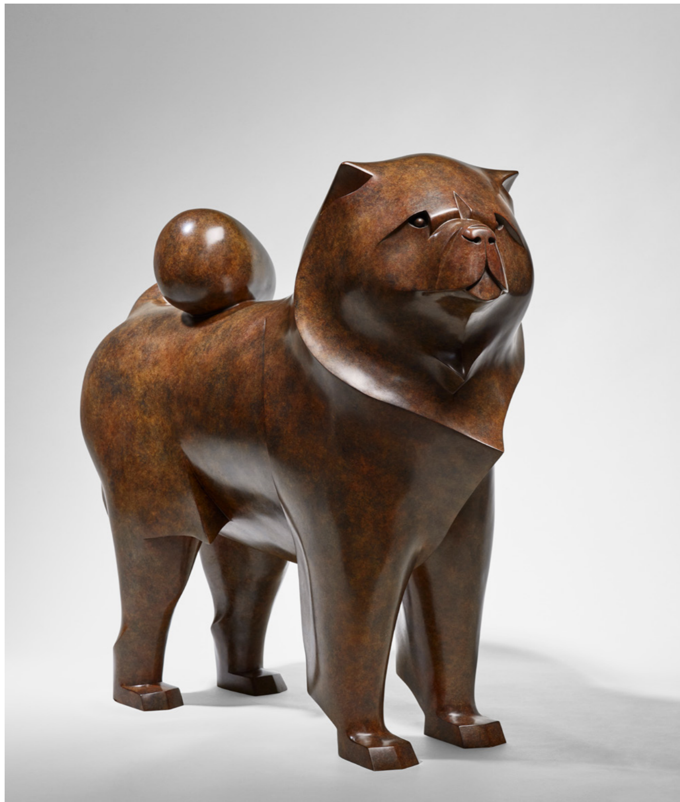
Goodee le Chow Chow Goodee the Chow Chow 松狮 - 古蒂