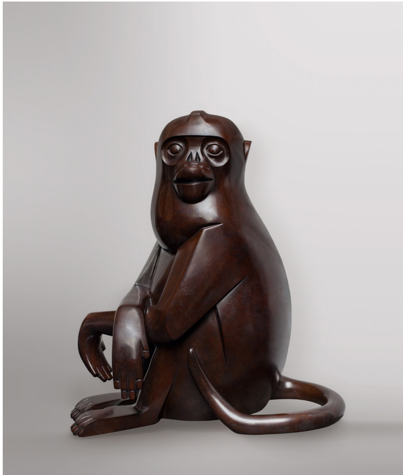
Singe Doré Assis Golden Snub-Nosed Monkey 金丝猴