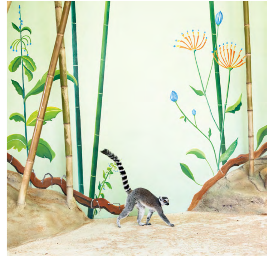
Vari Lemur and bamboos, 2011