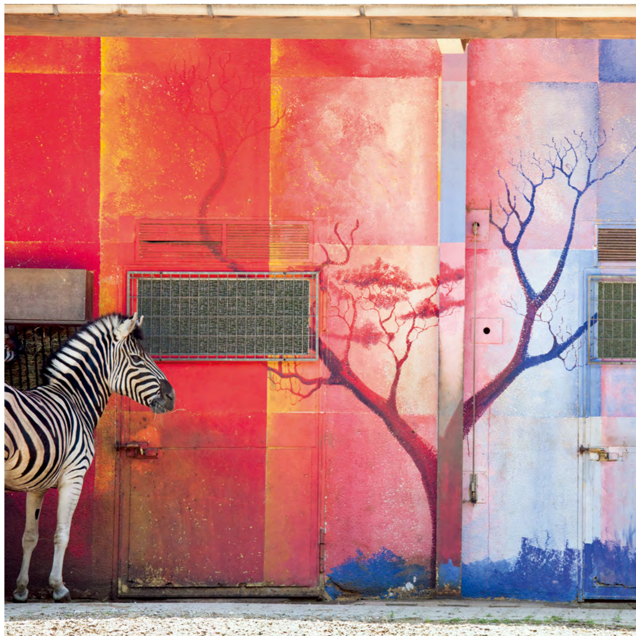
Zebra and red wall, 2011

To date, the work of French photographer Eric Pillot has been shown in over 70 collective and personal exhibitions in Europe, Australia, the United States and Asia, and in 2017 he has numerous others scheduled, including the Festival de la Gacilly, Photo Phnom Penh, Photo Shanghai, Fine Art Asia and PAD London. Eric Pillot learned to photograph as a child, using film, and after having studied engineering and science, he