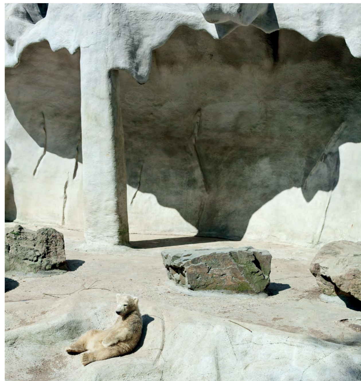
Bear cub and grotto, 2011

where they lived. He then continued with his Zoo series, again in black-and-white, where the relationship between animal and architecture began to be the center of his photographic experimentation. With this his most recent In situ arrives the choice of color to express the marvelous tonal hues of animals: the transition to digital was inevitable, without the use of either a tripod or flash in those places where natural daylight