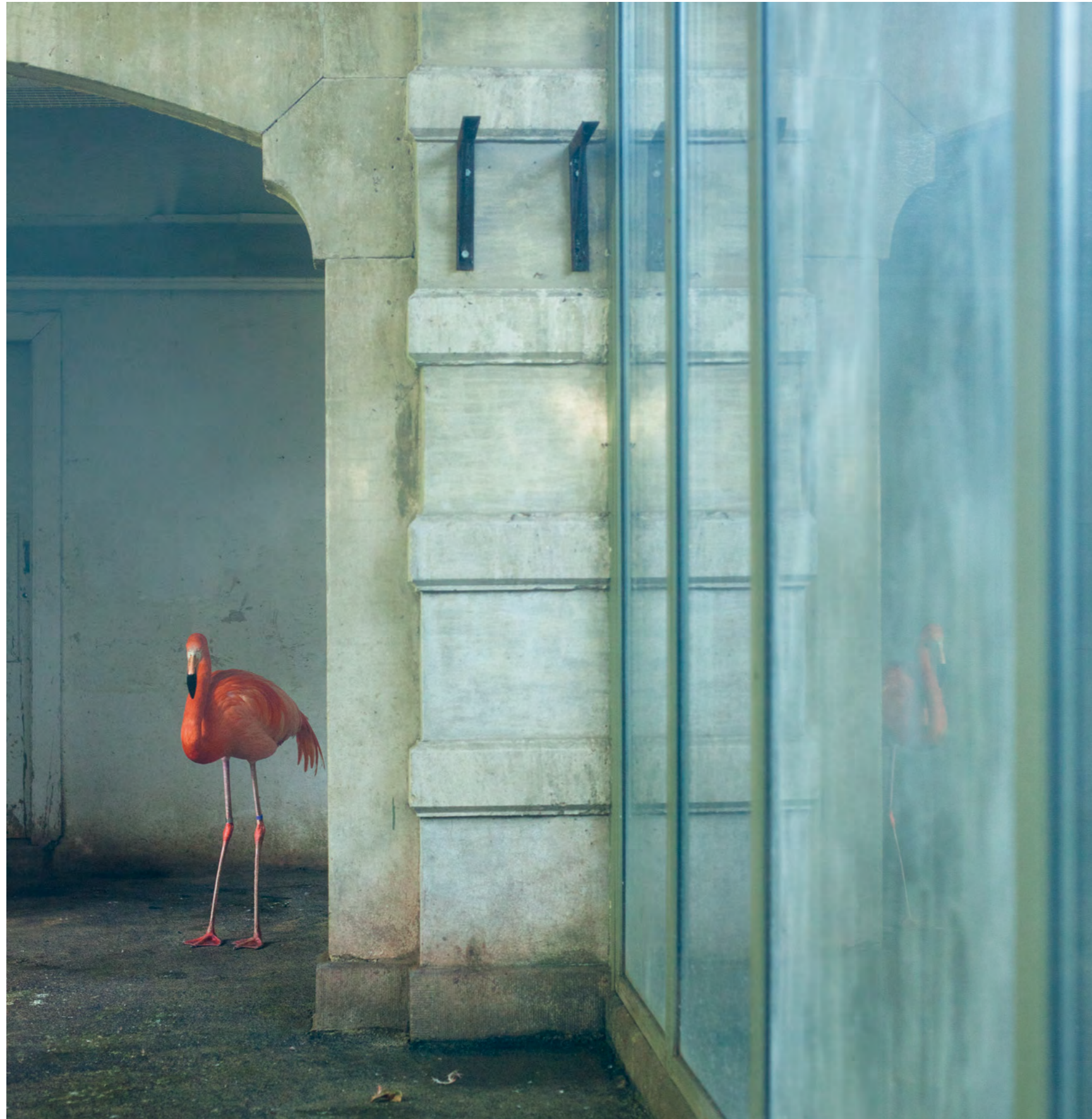
Blue Flamingo, 2010