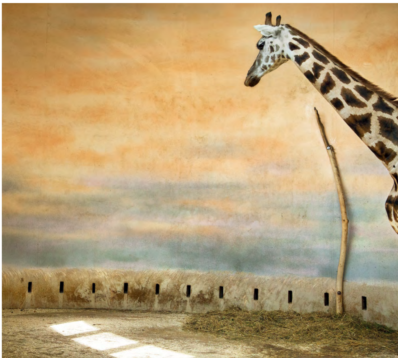
Giraffe and light, 2012

Le fotografie del francese Eric Pillot ad oggi sono state esposte in oltre 70 mostre, tra collettive e personali in Europa, Australia, Stati Uniti e Asia, e per il 2017 ha in programma numerosi appuntamenti tra cui il Festival de la Gacilly, Photo Phnom Penh, Photo Shanghai, Fine Art Asia, PAD London. Eric Pillot ha imparato a fotografare da bambino, con la pellicola, e dopo un percorso di studi ingegneristici e