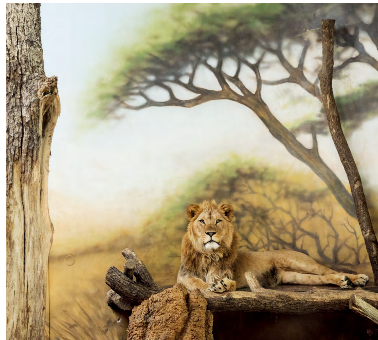
Lion under a tree 2014 All images © Eric Pillot

davanti al grande vetro della vasca dove vivono. Questo percorso è continuato con la serie Zoo, sempre in bianco e nero, dove il rapporto tra animali e architettura comincia ad essere al centro della sua ricerca fotografica. E' con In situ che arriva la scelta del colore, per esprimere quelle meravigliose tonalità degli animali: il passaggio al digitale è stato inevitabile senza l'utilizzo del treppiede e né del flash, in quei luoghi dove la luce naturale