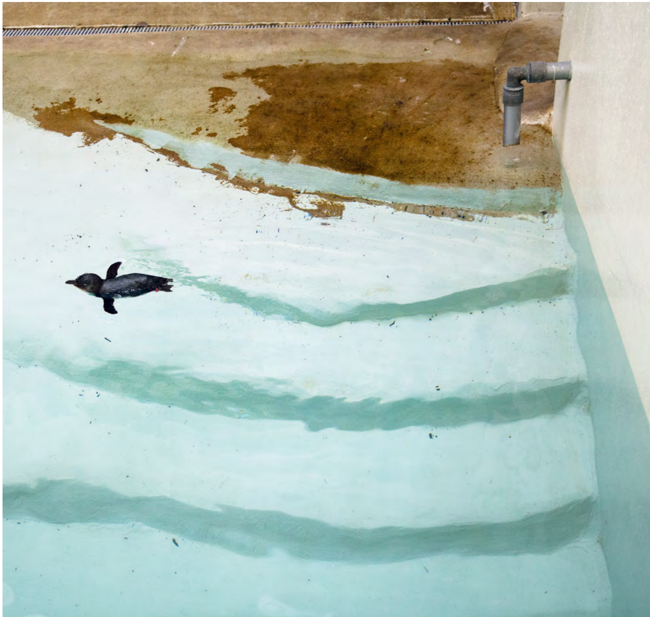
Penguin and waves, 2011