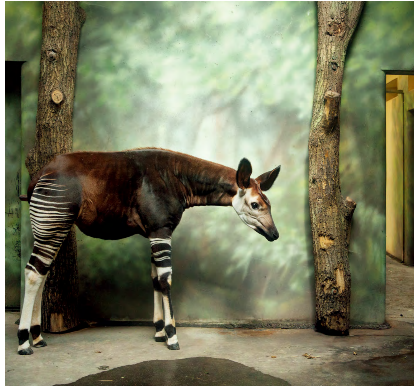
Okapi and forest, 2012