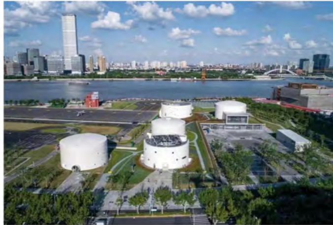
油罐艺术中心外景

致力于打造目前“中国唯一”一个专注于展示具有收藏价值的限量版设计的平台”，上海国际收藏级设计展Unique Design Shanghai 由现代传播与法国机构完美跨界Perfect Crossovers 共同发起，选址西岸新地标油罐艺术中心，并将与上海11月的两大艺博会与展览季同期进行。除西岸艺术与设计博览会与上海021当代艺术博览会之外，11月将迎来首届“上海国际艺术品交易月”；与法国巴黎蓬皮杜国家艺术和文化中心（Centre Pompidou）展开5年合作的西岸美术馆亦将于11月正式开馆。