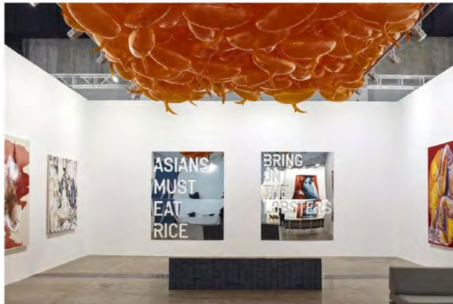
2018年诺贝尔文学奖获得者 (Pilar Cornelis, 荷兰雕塑家)

今日起，上海正式进入“艺术季”。期间，我们将看到先锋的视觉艺术，经历酷炫的感官体验。漫步在眼花缭乱的艺术作品中，生活中潜藏的想象力和激情亦会在某一时刻被点燃，绽放出这个秋天美丽的火花。在此，请收下我们准备的这份“艺术现场指南”。