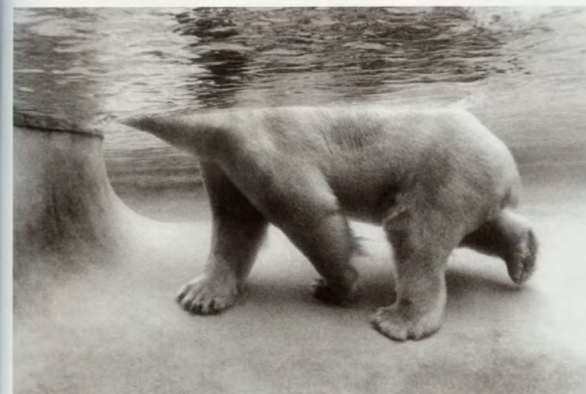
Éric Pillot, série D'Ours , 2004, tirage argentique, dimensions variables.

Éric Pillot a délaissé les mathématiques pour s'adonner à l'image, surtout du monde animal, ce qui lui vaut le Prix HSBC pour la photographie 2012.