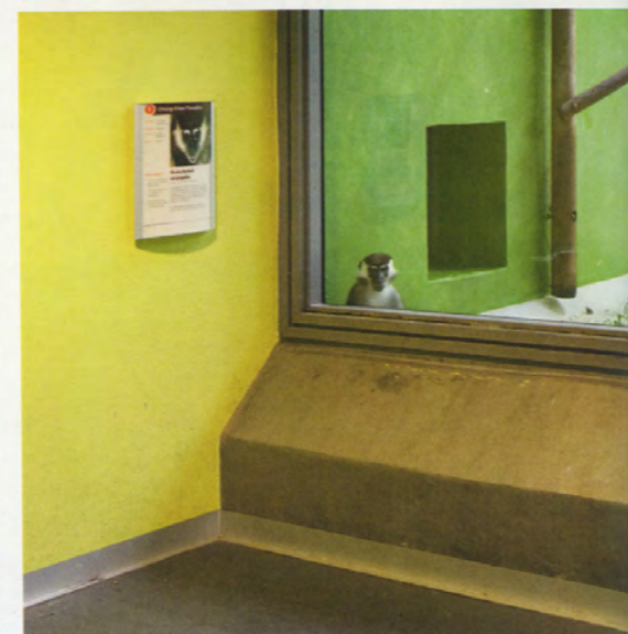
En haut, à gauche : Gorille et arbres peints , 2010, encres pigmentaires sur papier mat contrecollé sur aluminium, 100 x 100 cm (©ÉRIC PILLOT). À droite : Durson et grotte , 2011, encres pigmentaires sur papier mat contrecollé sur aluminium, 100 x 100 cm (©ÉRIC PILLOT). En bas, à gauche : série Zoos , 2006, tirage argentique, 70 x 105 cm (©ÉRIC PILLOT). À droite : série In Situ , 2010, encres pigmentaires sur papier mat, 100 x 100 cm, récompensée par le Prix HSBC pour la photographie 2012 (©ÉRIC PILLOT).