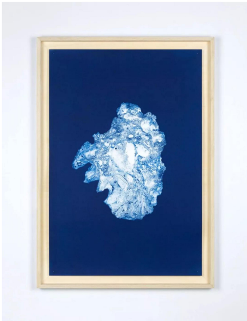
雨果·德维切尔 Hugo Deverchère | 万象-记录（玄武玻璃）Cosmorama - Recording (Tachylite) | 2017 | 蓝晒印相法，Arches 水彩纸，杨木胶合板 Cyanotype print on Arches paper, poplar plywood | 122 x 86 x 6 cm

雨果·德维切尔的作品最具有蔚蓝海洋的气质。但其实，他的蓝色并不是海洋，而是“天空”——他的这组《万象-记录》是与西班牙特内里费岛泰德天文台合作的作品，素材有用望远镜拍摄到的恒星星团、火山石碎片和NASA测试“好奇号”的熔岩沙漠里采集到的动物信息等。那或许甚至是超越所有地球生命的原始生灵。当这些形象经由雨果特有的图像转化技法固定成图像摄影，却显得特别“科幻”，其实那是凌驾于我们五官感知的存在。