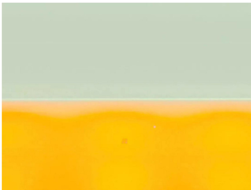
米歇尔·特曼 Michel Temman | 海洋 奥斯陆 | Sea.Oslo I | 2017 | 数码打印，铝塑板 Digital C print on aluminum composite panel | 70.5 x 52.5 cm

米歇尔·特曼本身就是塔拉基金会团队的成员，也是基金会亚洲区的总监。特曼还曾担任塔拉科考期刊的主编（2012-2015）。特曼充分发挥早年摄影记者的经验，在摄影成像上动了脑筋——着重对色彩进行改变，并将之形塑为立体主义、波普艺术和超现实主义相糅合的视觉风格。此番展出的两件海景摄影作品，原本只是海天一线的风景，经由特曼有意改变色彩而形成一个超现实的空间，似乎我们已经走入海洋的内部世界。