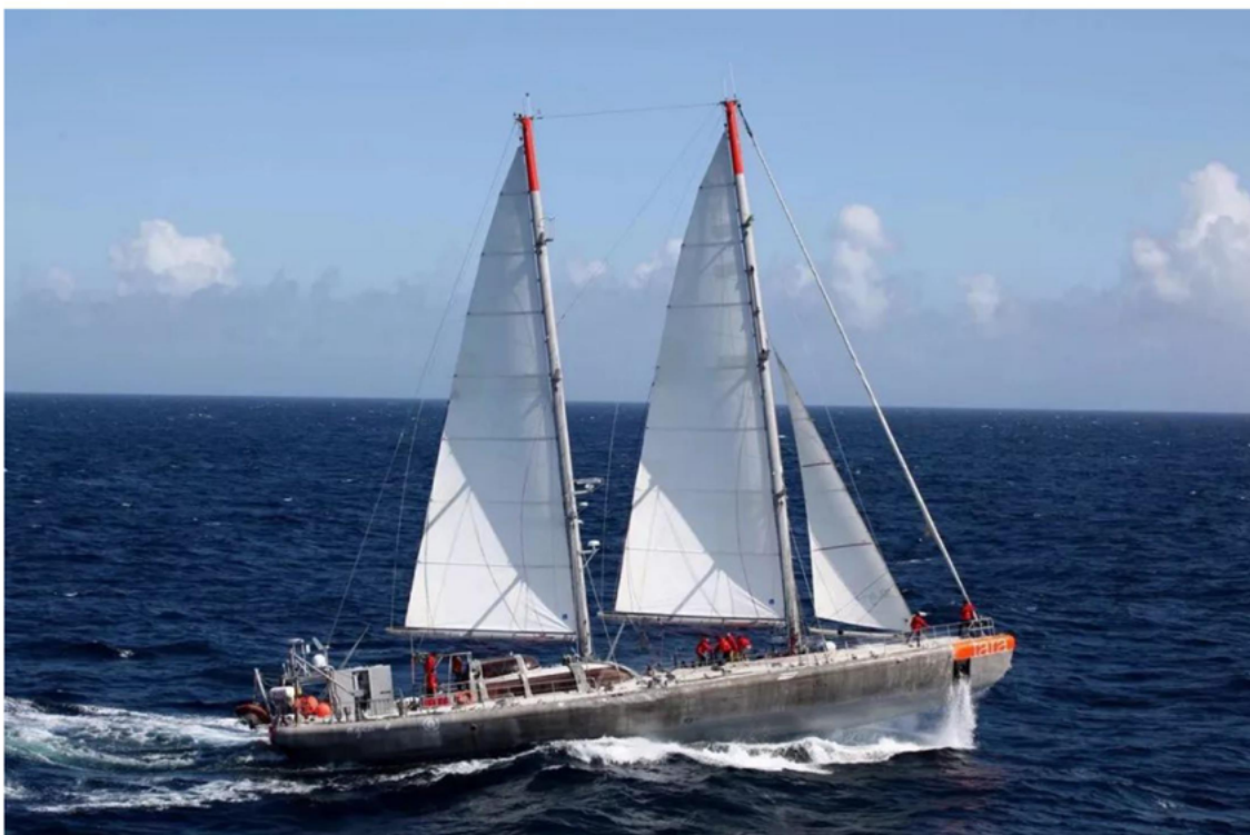
Tara voiles

是的，铝制帆船。它自2003年起在全球范围执行环境科考任务，致力于研究海洋生态与环境危机，以及气候变化对海洋的影响等议题。自2003年以来，航行超过45万公里，完成11次征程，在60多个国家停留。在2005年，塔拉号还建立了艺术家海上驻留项目，已邀请了几十位艺术家登船同行。