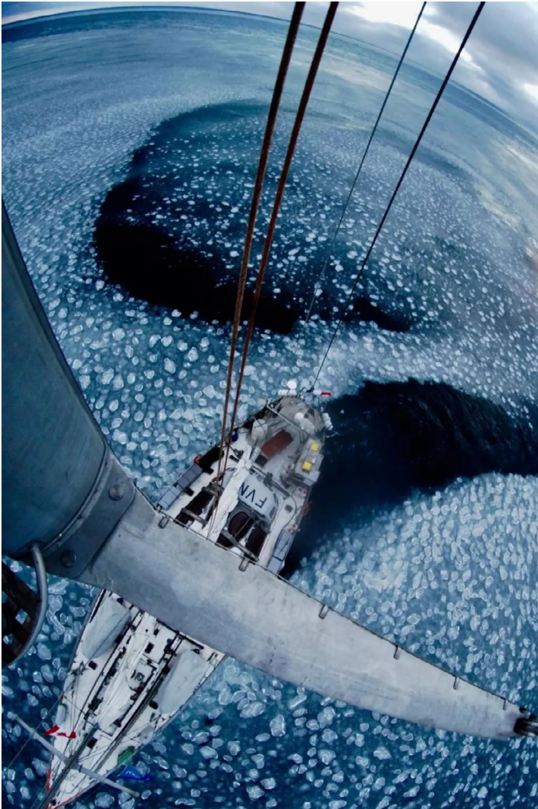
弗朗索瓦·奥拉 François Aurat | 北极 Arctic | 2013 | 数码打印，铝塑板 Digital C print on aluminum composite panel | 70 x 50 cm

弗朗索瓦·奥拉本身的身份很有意思，他既是摄影师也是船员。而以前他是一位冲浪教练并拥有一家冲浪器材店。2008年加入塔拉基金会团队。在塔拉号担任首席甲板官的十年间，他参加了三次科考旅行：“塔拉·海洋巡游”“塔拉·地中海”和“塔拉·太平洋”。他总是用无人机拍摄，在他的《北极》中，塔拉号就像一位婀娜多姿的美人，横卧于蔚蓝无垠的海面上，而海面漂流水的轨迹则像交响乐中的音符，充满乐感。这张照片也成了此次展览的海报。