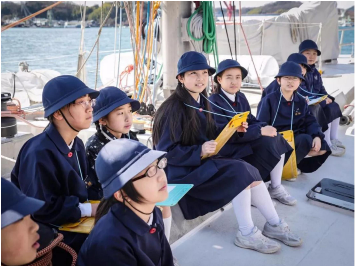
Onomichi, Japan, ©Noëlie-Pansiot, Tara Expeditions Foundation

所以，现在有了这样一个展览。杜梦堂画廊(Galerie DUMONTEIL)策划了这场名为 #「DEEP BLUE」- 致敬塔拉号 A Tribute to TARA # 的展览，想让更多人了解塔拉号、以及那些与塔拉号一起航行过的艺术家们。特别是希望大家关注环保的问题：全球变暖、塑料垃圾、珊瑚礁消失、蜉蝣生物的生态等一系列迫在眉睫的问题。