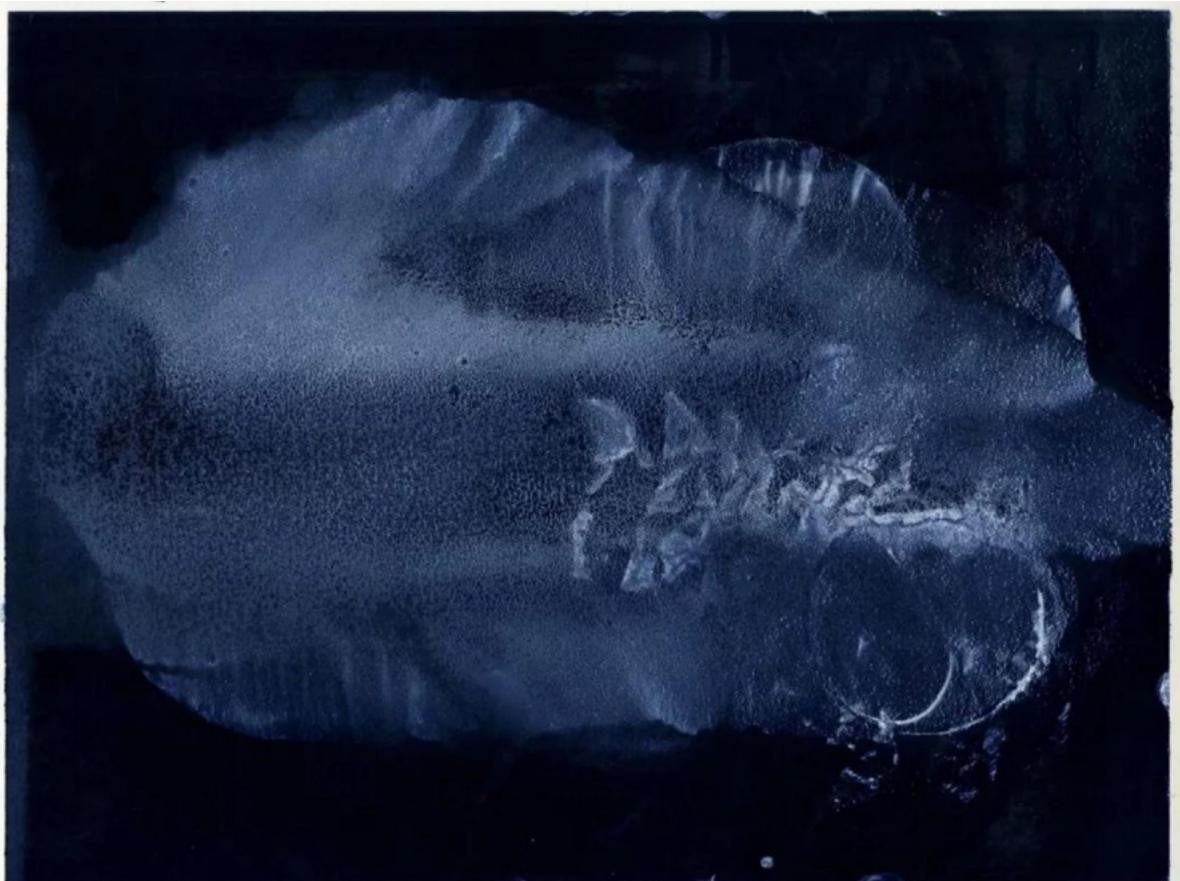
欧若尔·德拉莫里奈里 Aurèle De La Morinerie | 浮游生物 1 Plankton 1 | 2015 | 单刷版画印于日本纸 Monotype on Japan paper | 40 x 30 cm (画面 image) | 55 x 45 cm (裱框 with frame)

欧若尔·德·拉·莫里奈里的单刷版画《浮游生物》系列显得更有诗意，原来是艺术家借鉴了中国书画的水墨氤氲的意境，在创作中有意对笔触和色彩渲染进行了把控，并利用纸张的肌理和单刷版画特有的实验性和动态感，借由浮游生物这一独特的微观视角展现了海洋之蓝的无限可能。