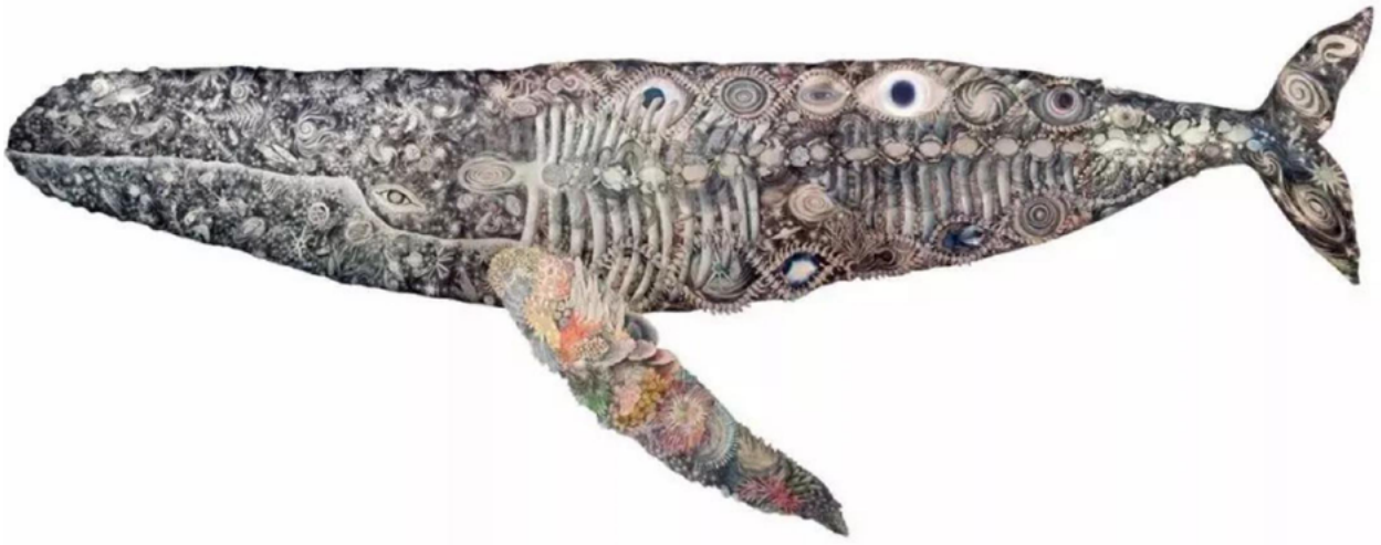
大小岛真木 Maki Ohkojima | 46亿年的记忆 - 鲸鱼 A memory of 4.6 billion years - Whale | 2017 | 铅笔, 丙烯, 皮革 Oil pencil and acrylic on leather | 长度 length 6 m

大小岛真木选择用一条大鲸鱼讲述海洋的故事，那些喜怒哀乐和伤痛甚至是死亡。因为鲸鱼死亡后会先沉入海底，过了一段时间会浮出水面，这时候，它们的遗骸就成了无数海洋微生物的寄居所，然后躯体渐渐被这些生物吃掉直至只剩白骨。真木用皮革、织物来拼贴、手绘而成的长达6米的“鲸鱼”，在她的眼里，鲸鱼是海洋的使者、地球的化身，她温情脉脉地述说鲸鱼与大海的故事。鲸鱼的身上不仅有浩淼的海洋生物们，还有日月星辰的银河。然而，走近看细节，我们会发现，慢慢的，繁华褪色，肉体成为枯骨，那是生命最终的归宿，但也应是新生循环伊始。在作品延伸到展墙上的笔记写道“无人岛上有很多的鸟”。