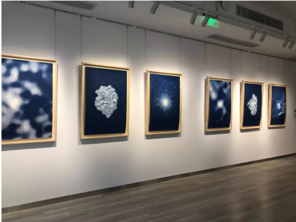
展览现场 | 雨果·德维切尔的《万象》蓝晒摄影系列

欧若尔·德·拉·莫里奈里的单刷版画《浮游生物》系列显得更有诗意，原来是艺术家借鉴了中国书画的水墨氤氲的意境，在创作中有意对笔触和色彩渲染进行了把控，并利用纸张的肌理和单刷版画特有的实验性和动态感，借由浮游生物这一独特的微观视角展现了海洋之蓝的无限可能。