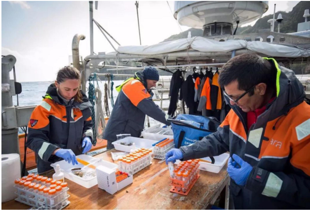
Coral team processing samples from the morning dive

杜梦堂画廊的艺术总监郑瑜欣女士说，第一次听说这艘造型特别的船是因为朋友的女儿、一个法国女科学家，她在船上待了8个月，没有下过地，据说是on board最久的女性科学家。她这8个月期间是为了研究环太平洋珊瑚礁的生存环境。后来再次听说，正值塔拉号在上海停靠。之前，它已去过日本、厦门、香港……在2018年停靠上海的15天内，塔拉号邀请了上海本地青少年登船，了解海洋环境和迫在眉睫的环境议题。