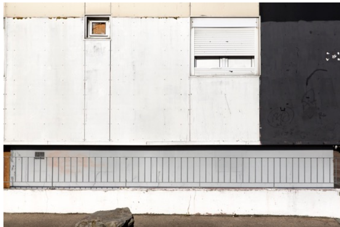
Parois 0183 , photographie, tirage à encres pigmentaires sur papier fine-art baryté, contrecollé sur aluminium, 58 x 80 cm limité à 8 ex.

Dans « Platitude : Une histoire de la photographie plate », Éric de Chassey traite de ce parti pris de nombreux artistes, comme Paul Strand ou bien Thomas Ruff, d'user de la photographie non pas pour ce à quoi elle avait été destinée, reproduire de la profondeur, mais pour créer des images plates, des surfaces pures. Les compositions d'Eric PILLOT relèvent de cette démarche et de cette recherche d'un point de vue spatial unifié.