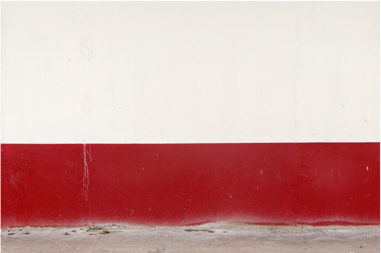
Parois 0404, photographie, tirage à encres pigmentaires sur papier fine-art baryté, contrecollé sur aluminium, 80 x 110 cm limité à 8 ex.

Du 18 octobre au 16 novembre 2019, la Galerie DUMONTEIL présentera pour la première fois, dans le cadre de son programme d'expositions contemporaines et pendant la période de Paris Photo, la dernière série de photographies d'Éric PILLOT.