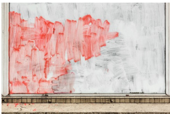
Eric PILLOT Parois 8433

Tirage à encres pigmentaires sur papier fine-art baryté, contrecollé sur aluminium, 58 x 80 cm limitée à 8 ex.