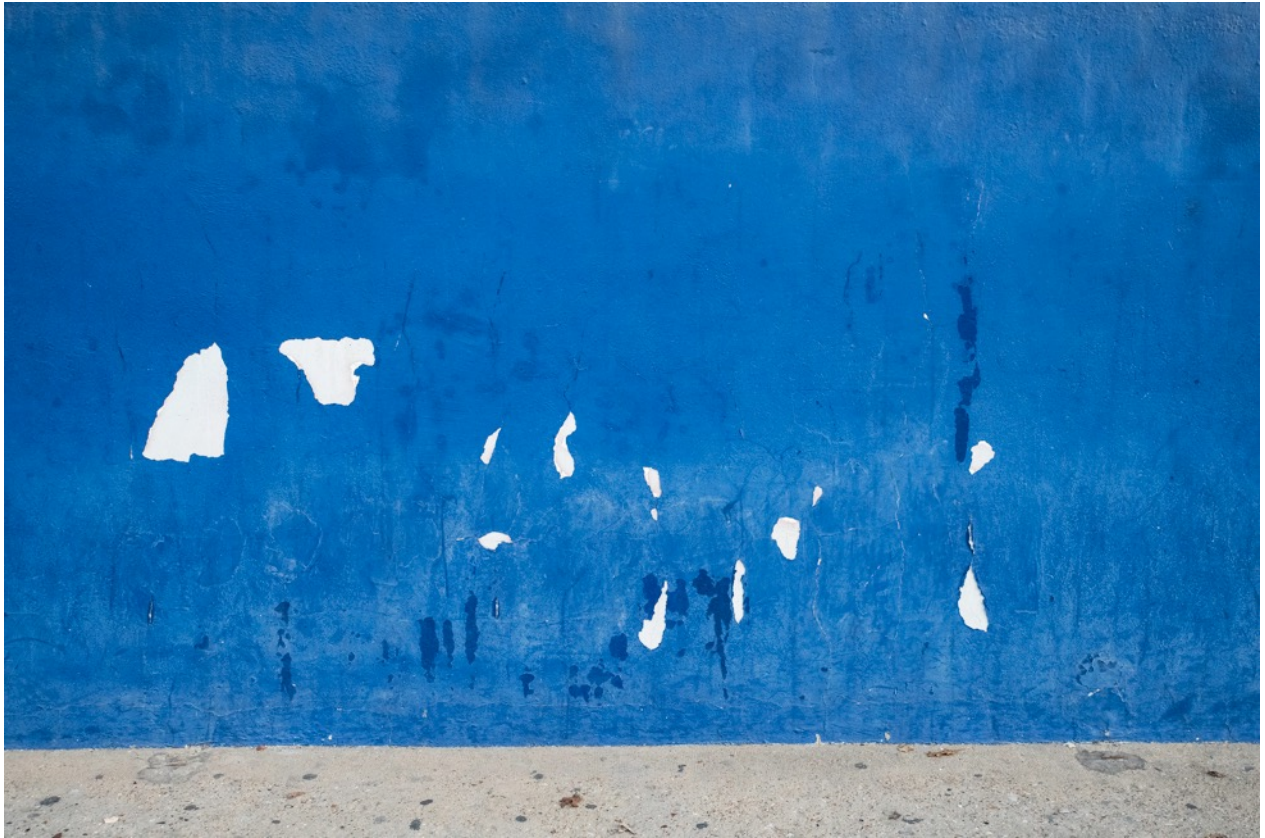
Parois 4354 , photographie, tirage à encres pigmentaires sur papier fine-art baryté, contrecollé sur aluminium, 125 x 176,5 cm limité à 8 ex.

À la manière des expressionnistes abstraits américains, la série photographique d'Eric PILLOT joue des aplats de couleurs vives et d'une négation de la perspective afin de stimuler l'imaginaire du regardeur, et lui laisser toute liberté d'interprétation.