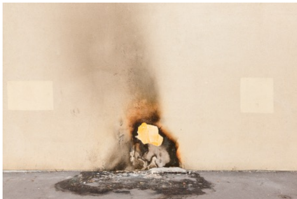
Eric PILLOT Parois 0130