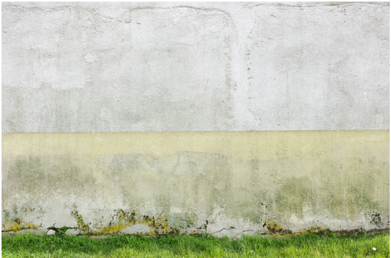
Parois 4923 , photographie, tirage à encres pigmentaires sur papier fine-art baryté, contrecollé sur aluminium, 58 x 80 cm limité à 8 ex.

La Nature est elle aussi actrice de ce spectacle. Elle est responsable de certaines salissures, craquelures, ou elle y fait des apparitions végétales.