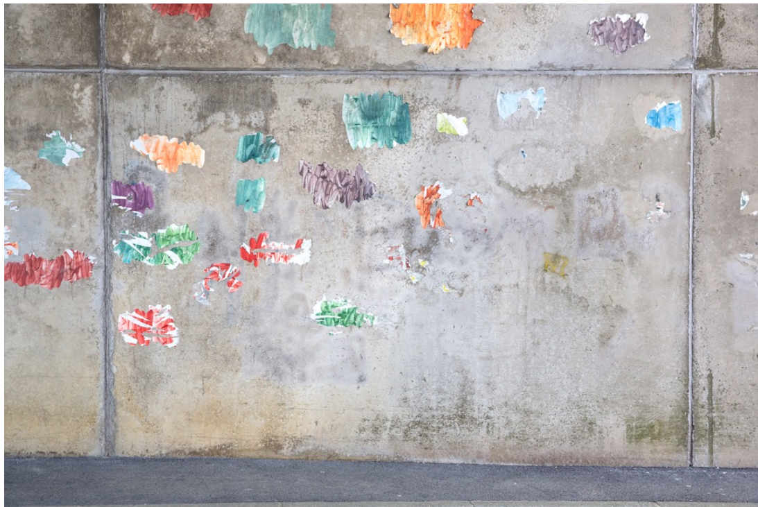
Parois 9207 , photographie, tirage à encres pigmentaires sur papier fine-art baryté, contrecollé sur aluminium, 80 x 110 cm limité à 8 ex.

« Parois » est le spectacle d'un environnement où la figure humaine n'apparaît pas, mais où l'homme est partout. En ce sens, « Parois » peut être également comparée à une démarche topographique, dans la lignée de l'exposition collective « New Topographs : Photographs of a man altered Landscape » en 1975 proposée par Georges Eastman House de Rochester avec les artistes Robert Adams, Lewis Baltz, ou encore Stephen Shore. Ces "nouveaux topographes" marquent une nouvelle forme d'approche, une étape constitutive dans la photographie de paysage. Les artefacts humains (objets, architectures, vestiges...) s'imposent à présent au paysage. Eric PILLOT comme ses prédécesseurs porte la mission d'immortaliser ces paysages urbains qu'il rencontre.