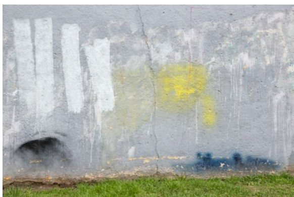
Eric PILLOT Parois 8786

Tirage à encres pigmentaires sur papier fine-art baryté, contrecollé sur aluminium, 58 x 80 cm limitée à 8 ex.