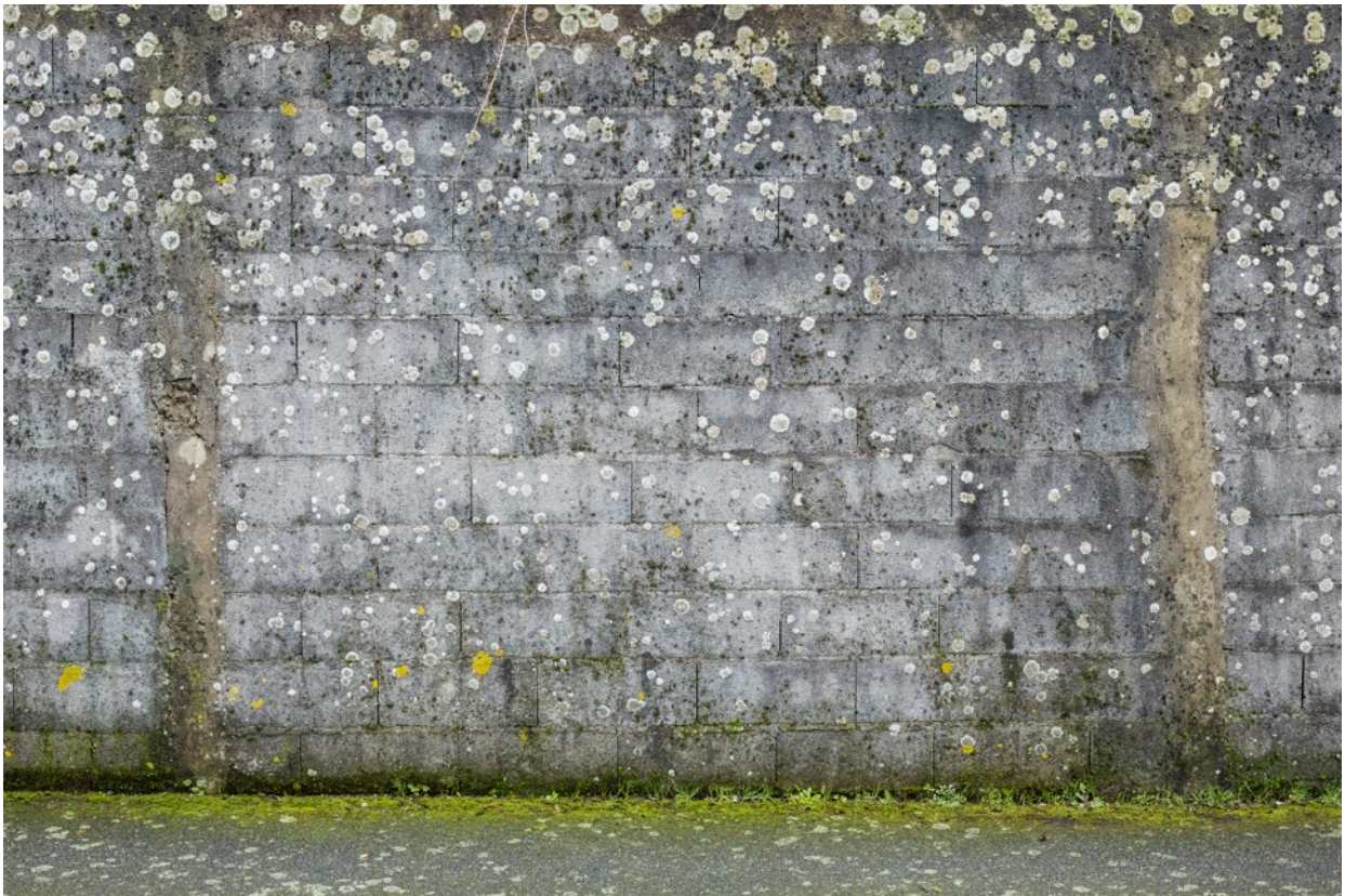
Parois 4670, photographie, tirage à encres pigmentaires sur papier fine-art baryté, contrecollé sur aluminium, 80 x 110 cm limité à 8 ex.

Dans cette nouvelle série photographique, Eric PILLOT pose son regard sur ce qui nous entoure au quotidien mais auquel nous ne prêtons pas ou peu d'attention, ces murs érigés qui accompagnent nos pas et façonnent nos paysages. Via l'acte photographique, en décontextualisant et en sublimant ces murs, l'artiste nous invite à leur contemplation et nous incite à la rêverie.