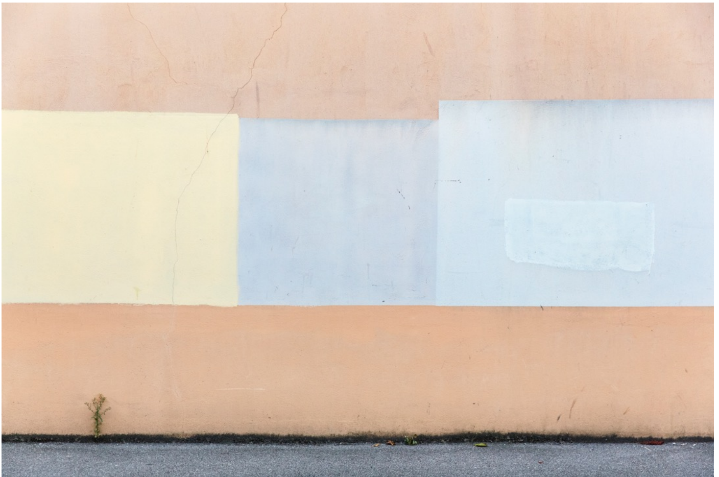
Parois 0237 , 2016, photographie, tirage à encres pigmentaires sur papier fine-art baryté, contrecollé sur aluminium, 80 x 110 cm limité à 8 ex.