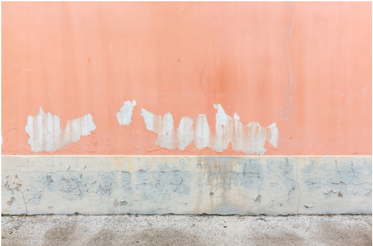
Parois 7973 , photographie, tirage à encres pigmentaires sur papier fine-art baryté, contrecollé sur aluminium, 80 x 110 cm limité à 8 ex.

Les paysages que nous offre Eric PILLOT se trouvent à la frontière entre abstraction et figuration. Le savant cadrage et la planéité de l'image sont conçus d'une telle façon qu'ils stimulent notre imaginaire et nous détachent d'une certaine réalité, vers une construction mentale, tandis que quelques éléments figuratifs (plantes, débris, craquelures) nous y ramènent.