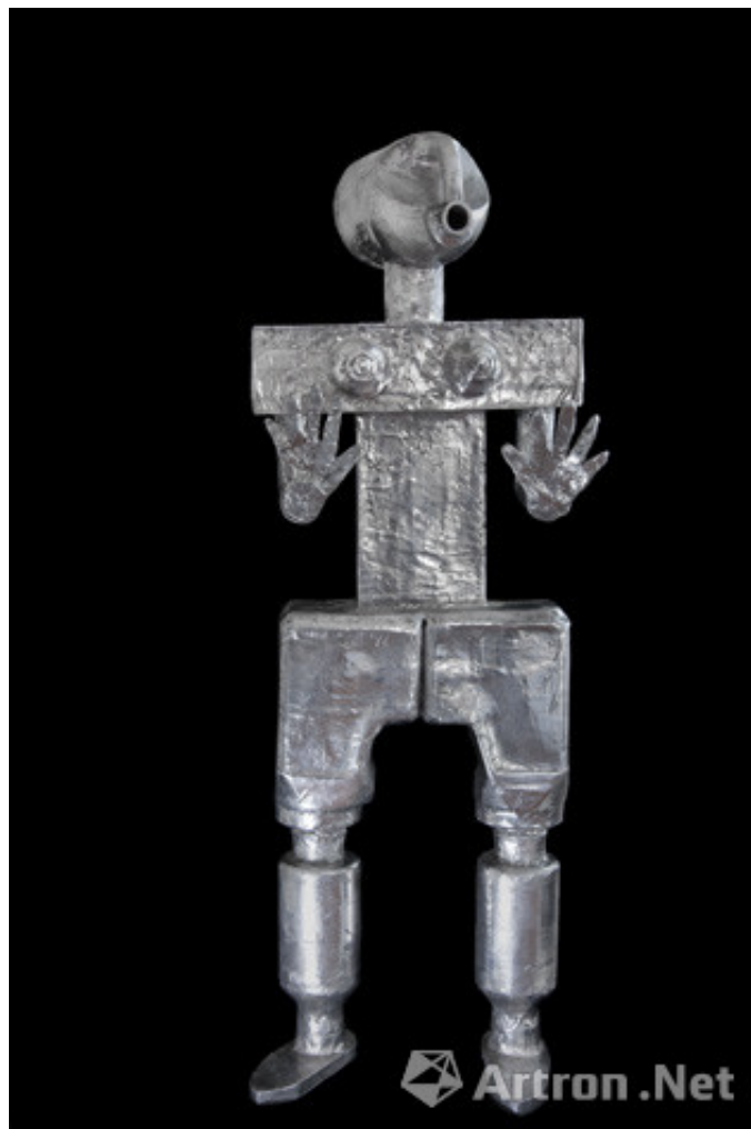
我 女机器人系列 抛光铝 2013 122 x 41 cm