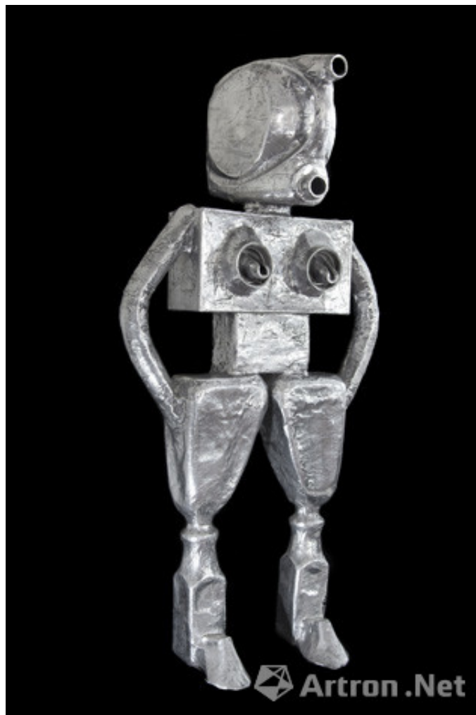
女机器人1 女机器人系列 抛光铝 201338 x 21 in. 96.5 x 53 cm