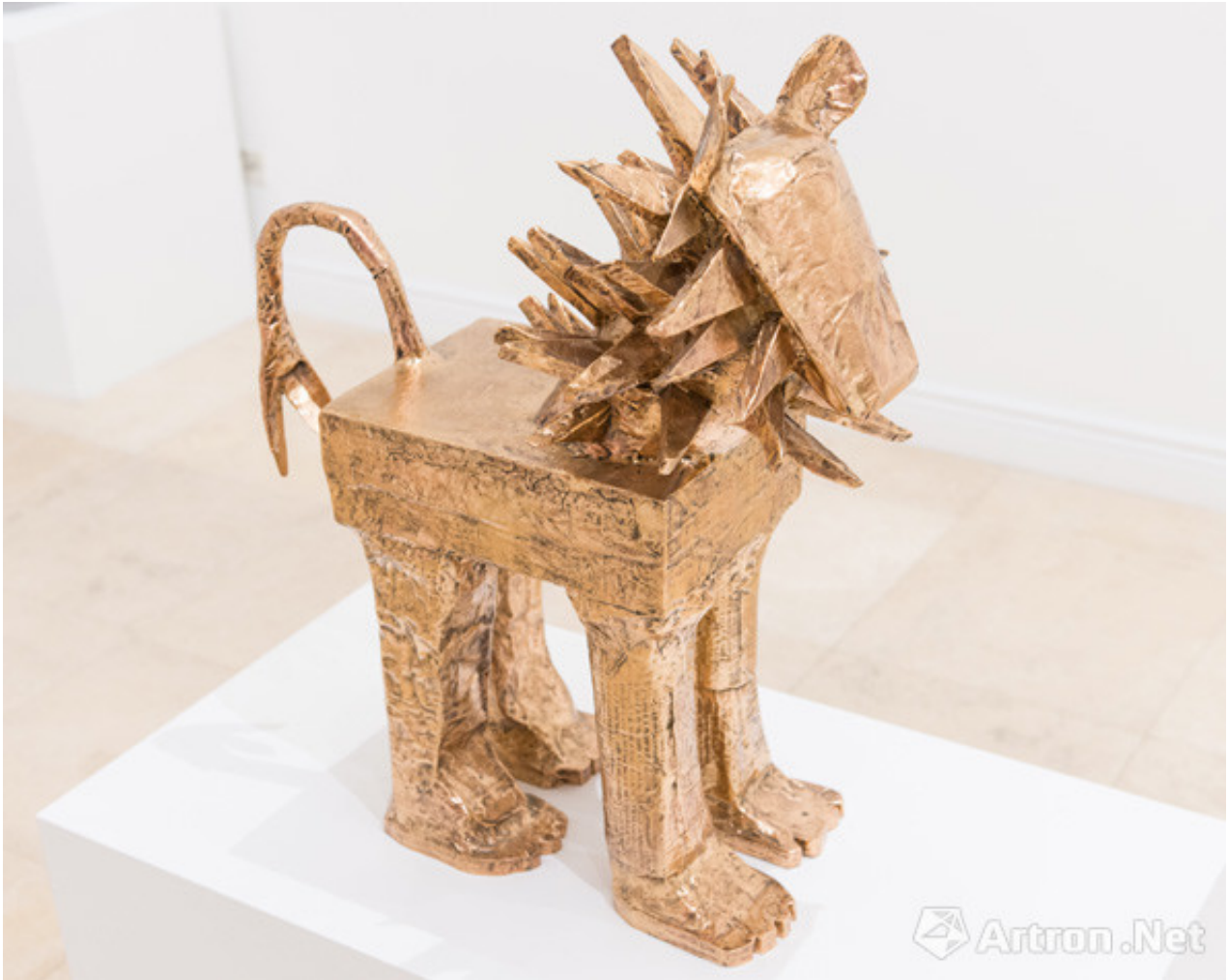
狮子 抛光铜 2013 68.5 x 30.5 cm