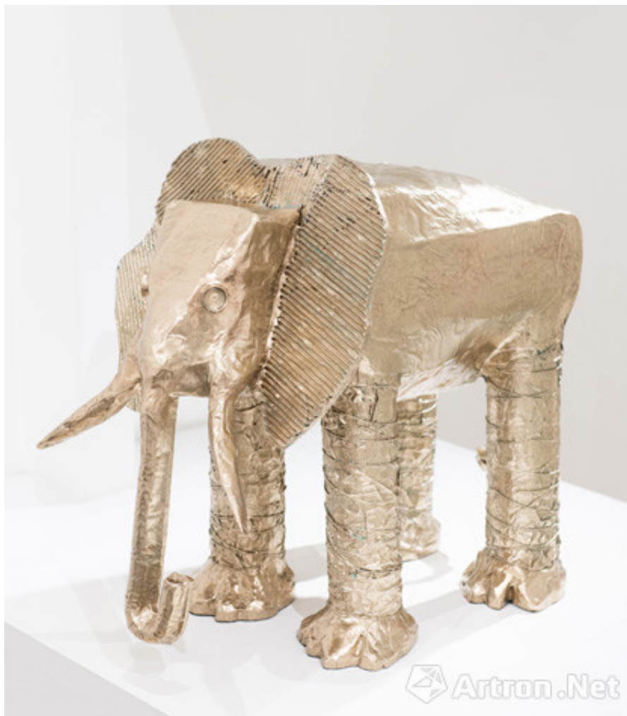
大象 抛光铜 2018 63.5 x 56 x 46 cm