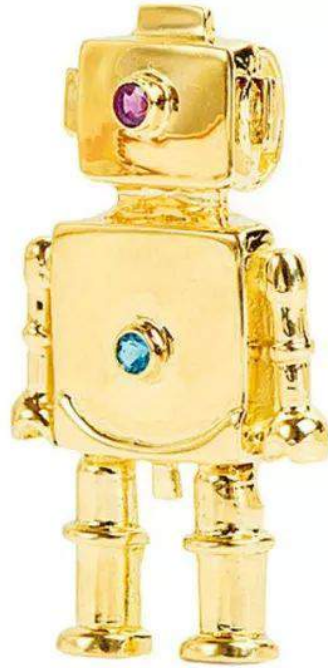
米娅设计的18K黄金原始机器人坠饰