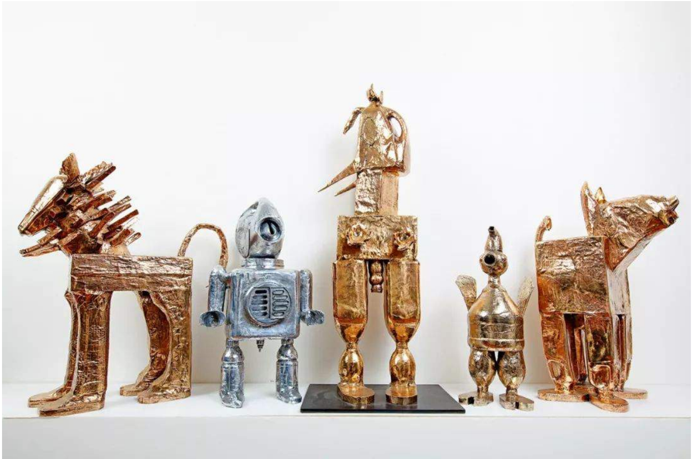
米娅创作的雕塑群

到和大型金属雕塑同样惊人的光彩。这就是我在这次展览中创作出青铜雕塑的原因，这种雕塑有着非常独特的高抛光铜绿色，它将这些大型金色雕像变为现实。”