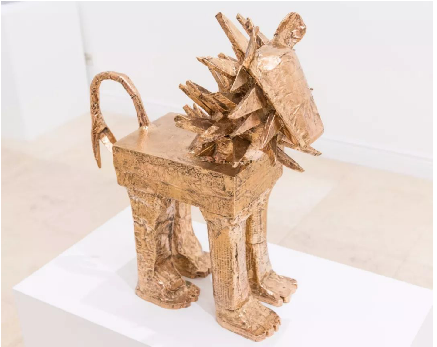
狮子 Lion , 2013, 抛光铜, 68.5 x 30.5 x 46 cm