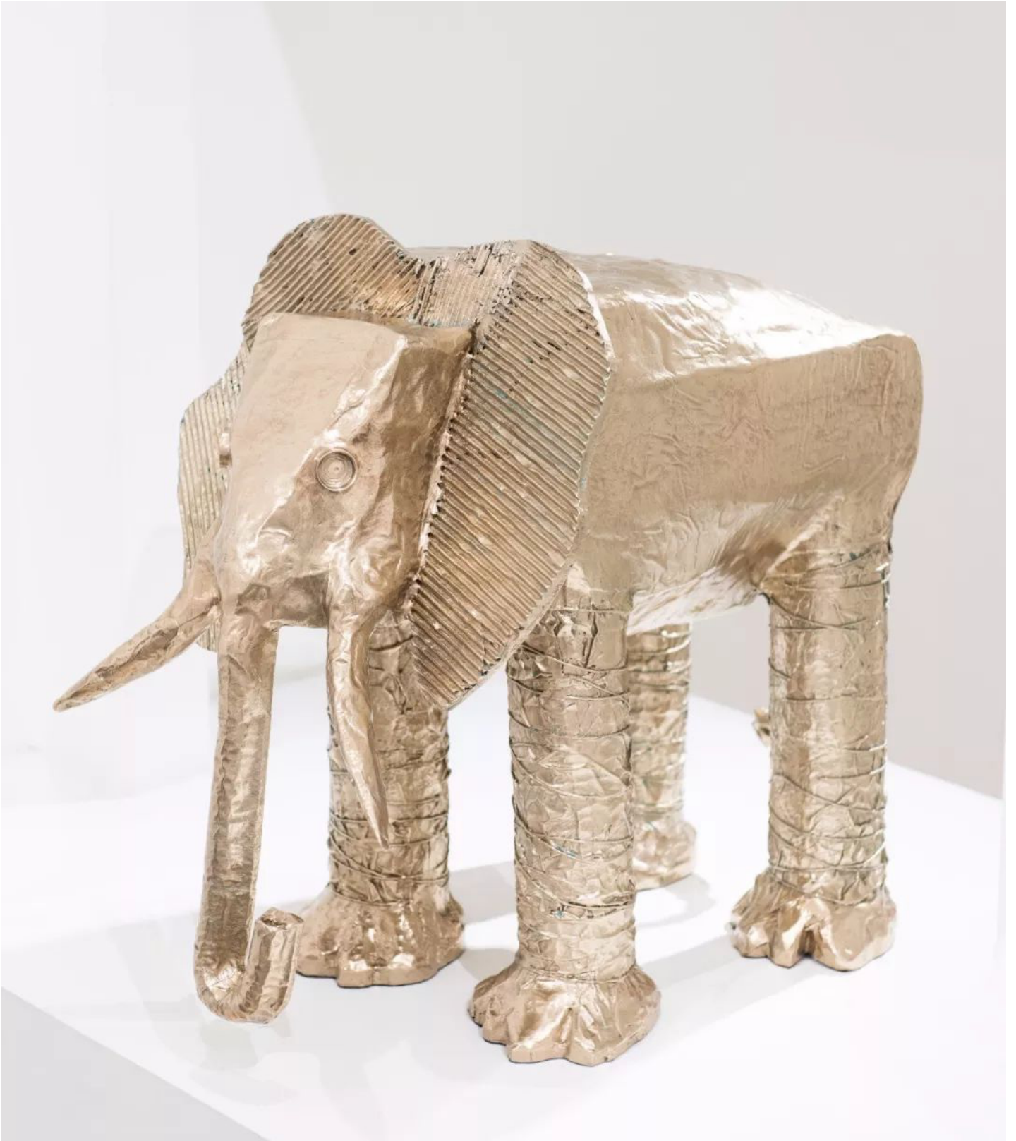
大象 Elephant , 2018, 抛光铜 , 63.5 x 56 x 46 cm