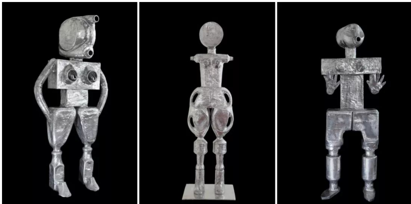
左：女机器人 Femme-bot ，2013，抛光铝，96.5 x 53 cm