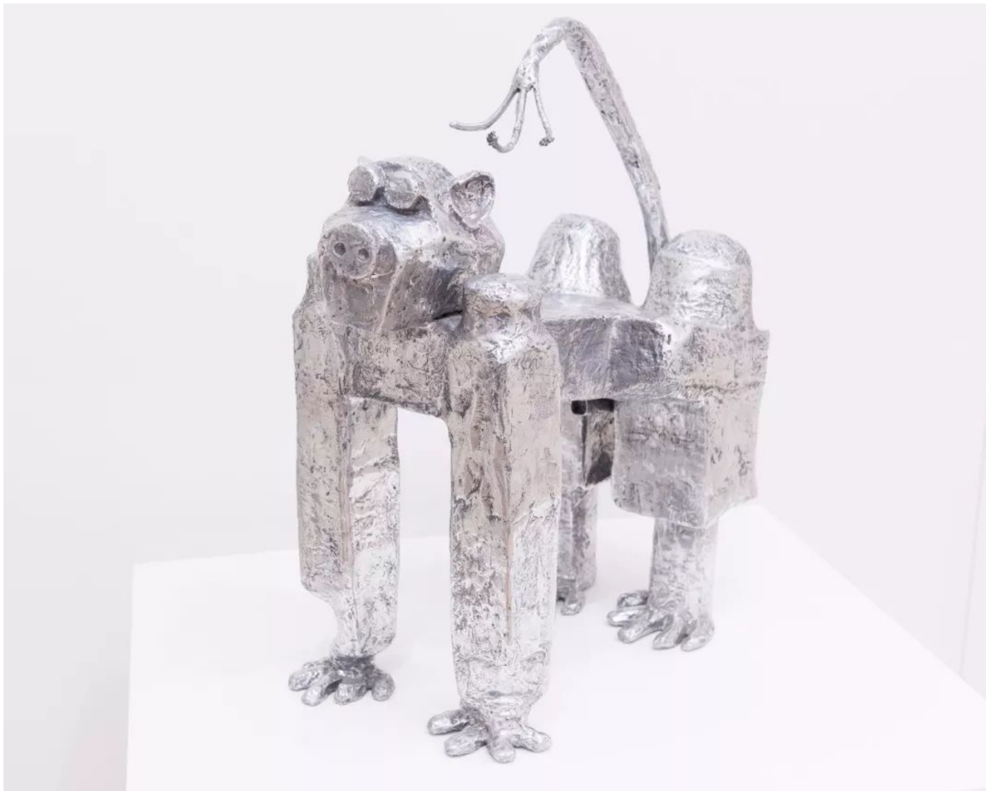
狒狒 Baboon , 2014, 抛光铝, 63.5 x 46 x 29 cm

芳夏格里芙·索洛的这些超脱寻常的未来主义动物寓言实则与艺术家的个人生活密切相关，是其个人情感寄托的产物。许多作品犹如肖像般唤起艺术家的特定回忆。艺术家曾在《白壁》杂志的采访中提到“这些机器人是在我生活中真实存在的人。每一个都特立独行，让你印象深刻！”[ Eiman Aziz, Whitewall , summer issue, 2015]