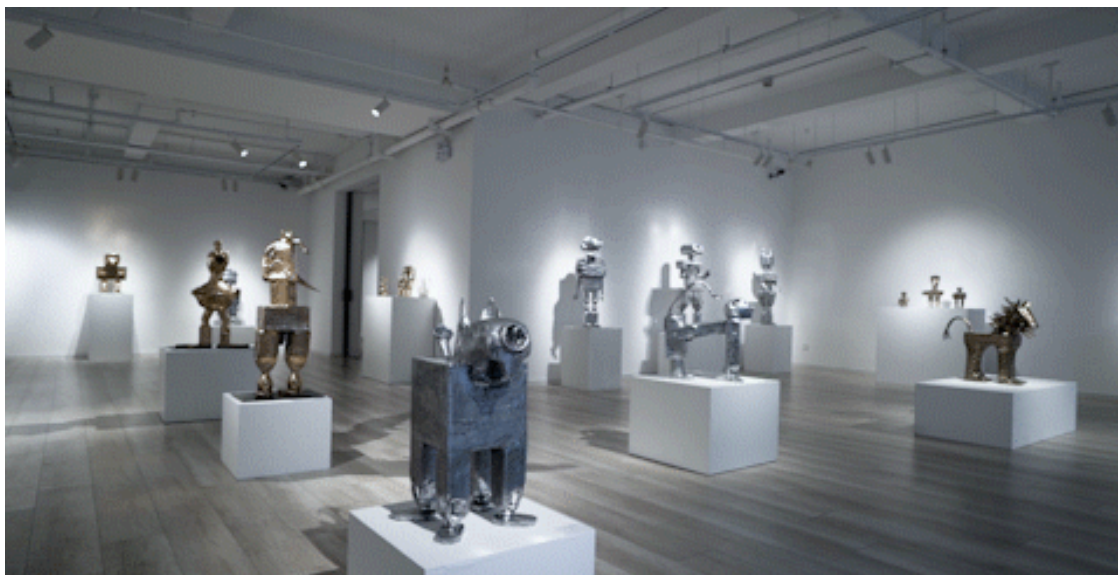
杜梦堂（上海），展览现场

这些雕塑的原型通常由艺术家搜集的回收物件组装而成，包括各类家用废弃物如塑料瓶罐、报纸简报、纸板和绳索等。这些具有男性、女性以及动物特征的机器人由铜、铝铸造而成，经高度抛光，共同呈现出一个属于混合物种的奇妙世界。作品强烈的金属质感让人联想起早期好莱坞电影《绿野仙踪》中的“无心锡人”，其独特迥异的造型则激起了我们在人工智能呼之欲出的今天对未来世界人类生活的无限遐想。