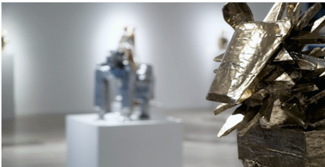
杜梦堂（上海），展览现场

这些雕塑的原型通常由艺术家搜集的回收物件组装而成，包括各类家用废弃物如塑料瓶罐、报纸简报、纸板和绳索等。这些具有男性、女性以及动物特征的机器人由铜、铝铸造而成，经高度抛光，共同呈现出一个属于混合物种的奇妙世界。作品强烈的金属质感让人联想起早期好莱坞电影《绿野仙踪》中的“无心锡人”，其独特迥异的造型则激起了我们在人工智能呼之欲出的今天对未来世界人类生活的无限遐想。