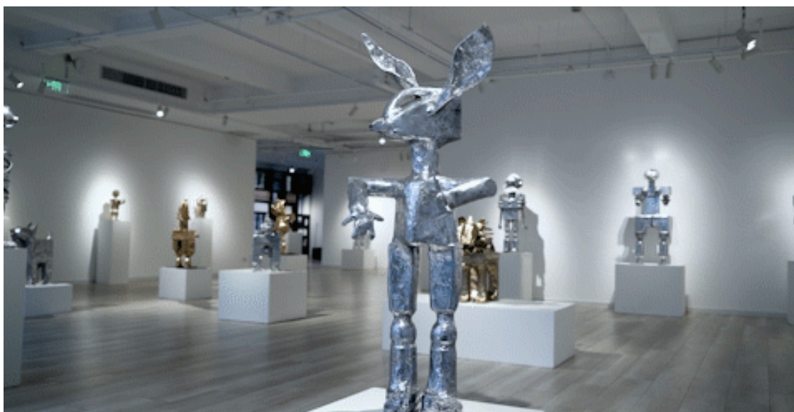
杜梦堂（上海），展览现场

本次展览通过作品形态与材质的多样性，将我们熟悉的日常物件转化为散发着金属光泽的“异形”，芳夏格里芙·索洛用幽默的方式表达，展现了其对远古自然界和人类历史进程的思索，并在现代工业化背景下放大和重塑了人与其所创造的象征图像之间的关联，邀请观众共同进入由艺术家及其作品组成的充满个性和活力的“异形”世界。