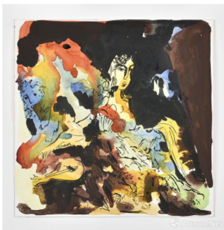
无题，JL#31，2017，纸上水彩，艺术家署名，标注日期，30 x 30 cm，孤品

杰思敏·莉特(Jasmine Little)是一位出生并成长于美国的新锐当代艺术家，毕业于加州洛杉矶分校UCLA，一直从事油画、水墨与水彩等绘画创作，在偶然参加的一次陶瓷雕塑实验课程后打开了她对于这一陌生艺术媒介的探索。2017年她参加了法国Lefebvre & Fils凡尔赛艺术家驻留项目，坚定了她此后转向对于当代陶瓷艺术的创作。