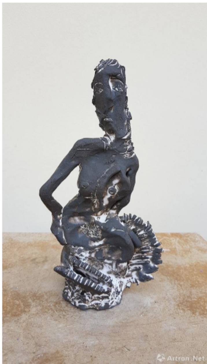
无题，JL#02，2017，釉面陶瓷，艺术家署名，标注日期，27 x 14 cm，孤品