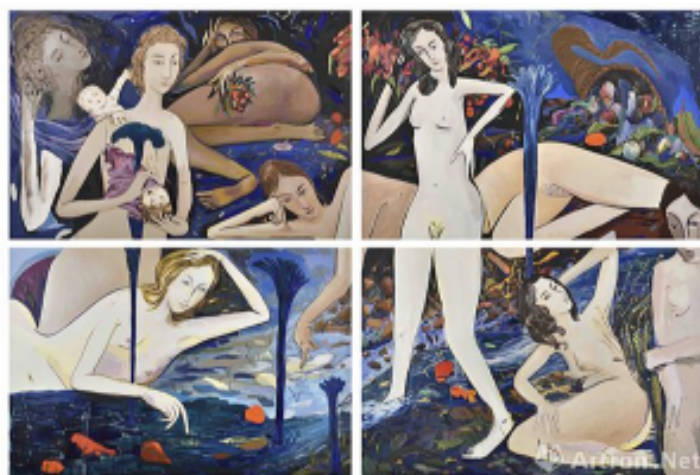
干燥的天气，JL#21，2017，布面油画，艺术家署名，标注日期，280 x 420 cm，孤品

在凡尔赛驻留期间杰思敏·莉特共创作了20件陶瓷作品和10件绘画作品，这一系列作品融合了野兽派风格和象征主义的艺术表达方式，以女性主义的视角诉说着自然与艺术的共生。本次展览中展出其共10组陶瓷作品，在乍看之下略显粗犷的形态之中或隐或现女性柔美的身体，在陶土中延展出体态不一的造型，形成了一种有趣的视觉反差。展出中的两件作品釉色丰润而大胆，鲜艳的色彩和涂抹方式彰显着当代陶瓷独有的艺术表达，也形成了杰思敏·莉特独具标志性的风格。