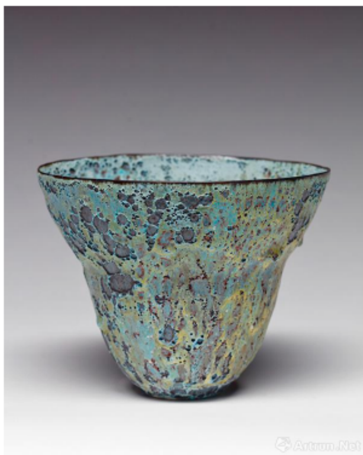
广口碗，JK#1113，2014，陶瓷，火山釉， 艺术家署名，标注日期，高 17.1 x 直径 22.9 cm，孤品

本次展览中展出的作品是艺术家近五年来的最新创作，这一组作品灵感来源于杰·柯彼成长的美国亚利桑那州的自然景致。作品的褐色基调让人联想到当地独特的沙漠性土壤结构，复杂工艺所形成的多层次釉料宛若广袤荒原中延展开的地平线。杰·柯彼作品中釉料的使用带有随机性特点的实验探索，在调制釉料配方时，杰·柯彼自称以类似厨师烹饪的手法逐步填料增色，对不可知性敞开怀抱以求非常规的全新样式。