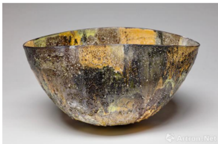
图五：卵圆形大碗，JK#1278，2017，陶瓷，火山釉，艺术家署名，标注日期，高33 x 直径 62.2. cm，孤品

杰·柯彼的陶瓷作品带有对艺术语言本源的求索精神，在谈及对自己作品时他表示：“我创作的只是陶器，我并不热衷于将其列入陶瓷艺术或者瓷器雕塑的范畴，我的作品就只是平实而朴素的陶器。我青睐于这种与祖先一脉相承的纯粹的态度，近乎成为一种语言形式。如果我的作品获得成功，我更愿意想象它建立起的是一种与我的陶瓷艺术前辈以及后辈们之间的对话。”