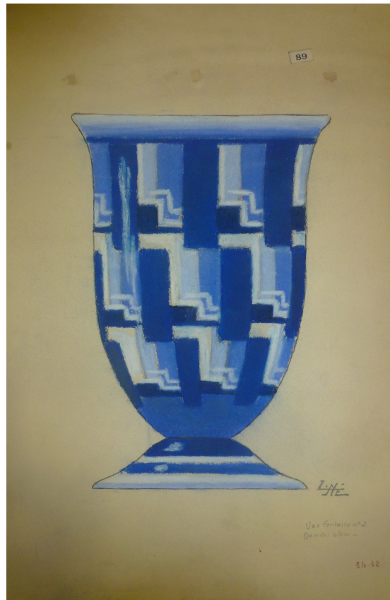
Vase Ruhlmann N°2 (decor Line's Blue Checkerboard 34-32 01-2) porcelain H.53, D.38cm

鲁尔曼瓷瓶 N°2 (林恩的蓝色棋盘装饰 34-32 01-2) 瓷器 高53cm, 38cm