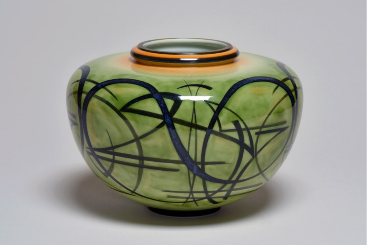
Vase Gensoli 8 (decor Silvaut 15-60 00-2) porcelain H.18, D.27cm