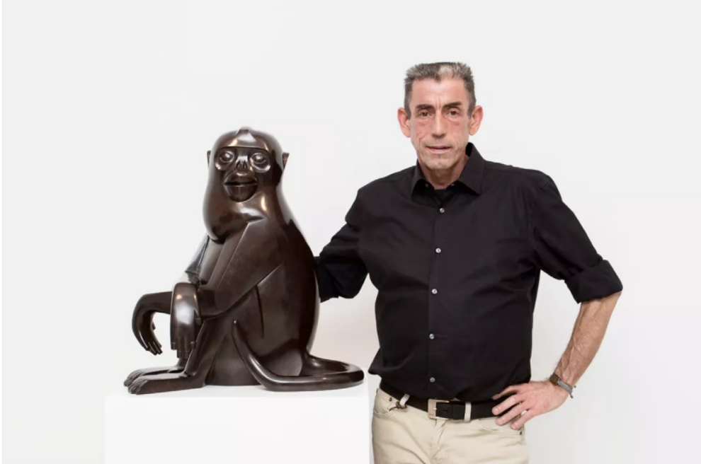
艺术家Daniel Daviau丹尼尔·达维欧，“万物有灵”展览现场，杜梦堂（上海），2018年，Photo JJYPHOTO

丹尼尔·达维欧（1962年出生于法国萨拉），曾先后在波城及巴黎学习雕塑专业，目前在巴黎生活和创作。