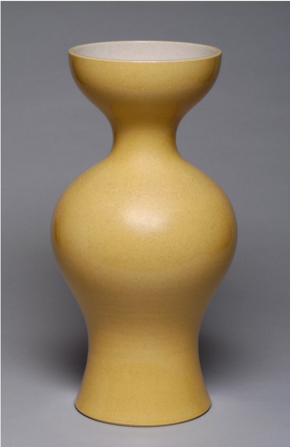
让·阿尔普 Jean Arp / Hans Arp (1866-1966) Vase Objet Casanier 平日物件 1966, 塞夫尔国家制造局 (Manufacture National de Sèvres) 炻器, 黄色, No. 8/10 H: 47.5 cm D: 23 cm